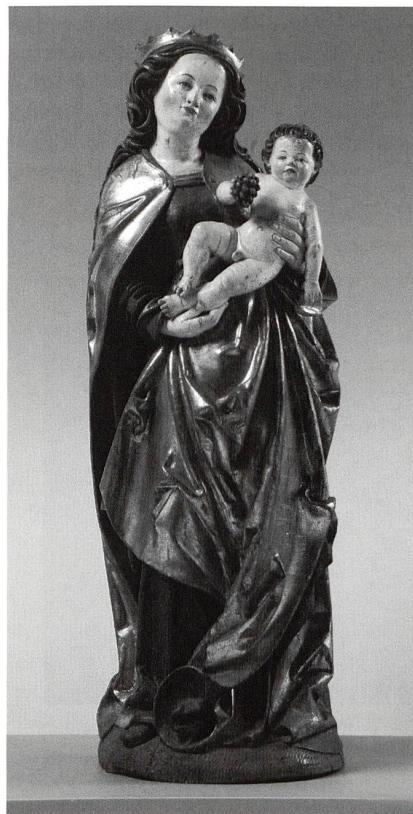
Madonna mit Kind, Freiburger Werkstatt, um 1515, Suermond-Ludwig Museum, Aachen. (Primula Bossard)