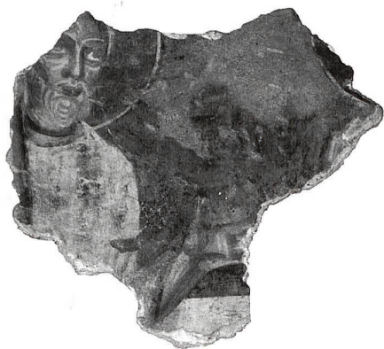
Miglieglia, chiesa di Santo Stefano al Colle, frammento raffigurante un volto aureolato, prima metà dell'XI secolo. (Irene Quadri)

Il ciclo cristologico nella chiesa dei Santi Pietro e Paolo a Sureggio, infine, è un altro pro-