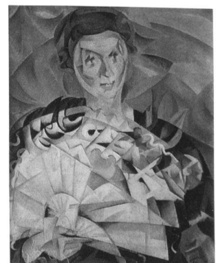
Alice Bailly, Femme à l'éventail, 1913, Musée cantonal des Beaux-Arts, Lausanne.

jusqu'au 15 janvier 2006, ma-me, 11h–18h, je, 11h–20h, ve-di, 11h–17h, fermé le 25 décembre 2005 et le 1 er janvier 2006. Musée cantonal des Beaux-Arts, Palais de Rumine, place de la Riponne 6, 1014 Lausanne, tél. 021 316 34 45, www.beaux-arts.vd.ch