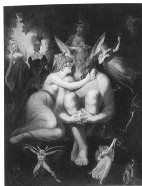
Johann Heinrich Füssli, Titania erwacht, 1793/94, Kunsthau Zürich.

bis 8. Januar 2006, Di-Do 10–21 Uhr, Fr-So 10–17 Uhr, 24./25.12. geschlossen, 26.12. und 1./2.1. 10–17 Uhr, 31.12. 10–15 Uhr. Kunsthau Zürich, Heimplatz 1, 8001 Zürich, Tel. 044 253 84 84, www.kunsthau.ch