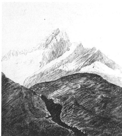
Vue de l'Aiguille de Bellaval, tiré de Voyages dans les Alpes , t. 1, pl. VII.

Il rappelle aussi, comme Buffon, le besoin d'embrasser le tout dans une vue large, en sachant s'arrêter aux détails sans s'y enfermer. Cette capacité à passer d'un ordre de grandeur à un autre, de sonder les recoins microscopiques d'un objet ou de le replacer au sein d'une structure ou d'un système, parmi d'autres échantillons, d'autres espèces, etc., sans se laisser fasciner par l'aspect spectaculaire ou monstrueux que de tels « zooms » peuvent prendre, aura une