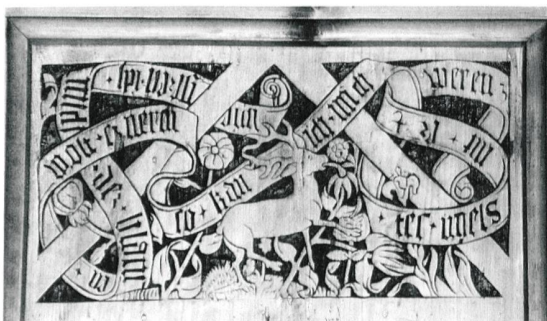
Mettmensstetten, Kirche, Decke des Schiffs von Ulrich Schmid, 1521. (Rahel Strebel)