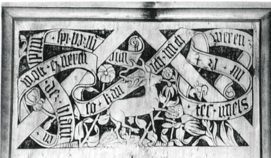
Mettmenstetten, Kirche, Decke des Schiffs von Ulrich Schmid, 1521. (Rahel Strebel)