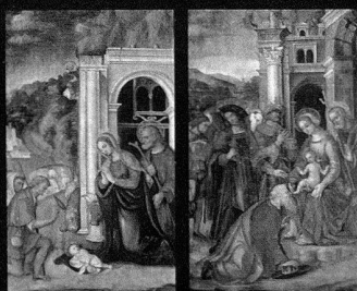
Oberseite: Eisenkiste aus der Vergangenheit