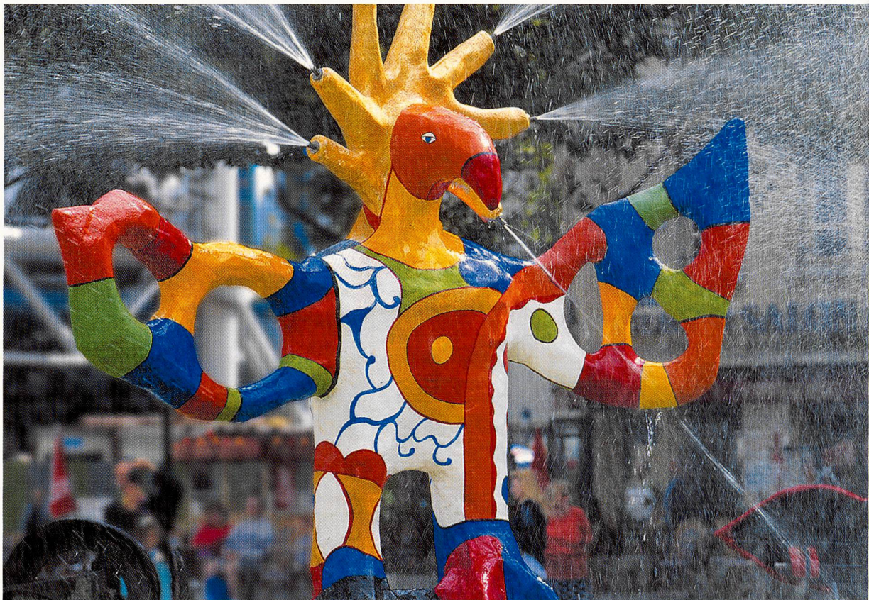
Centre Pompidou, Strawinsky-Brunnen, Paris