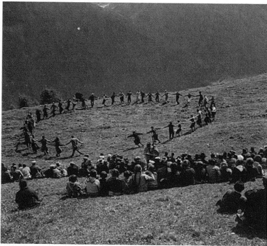
Schweiz: Gesellschaft für Volkskunde, Basel, DL 89