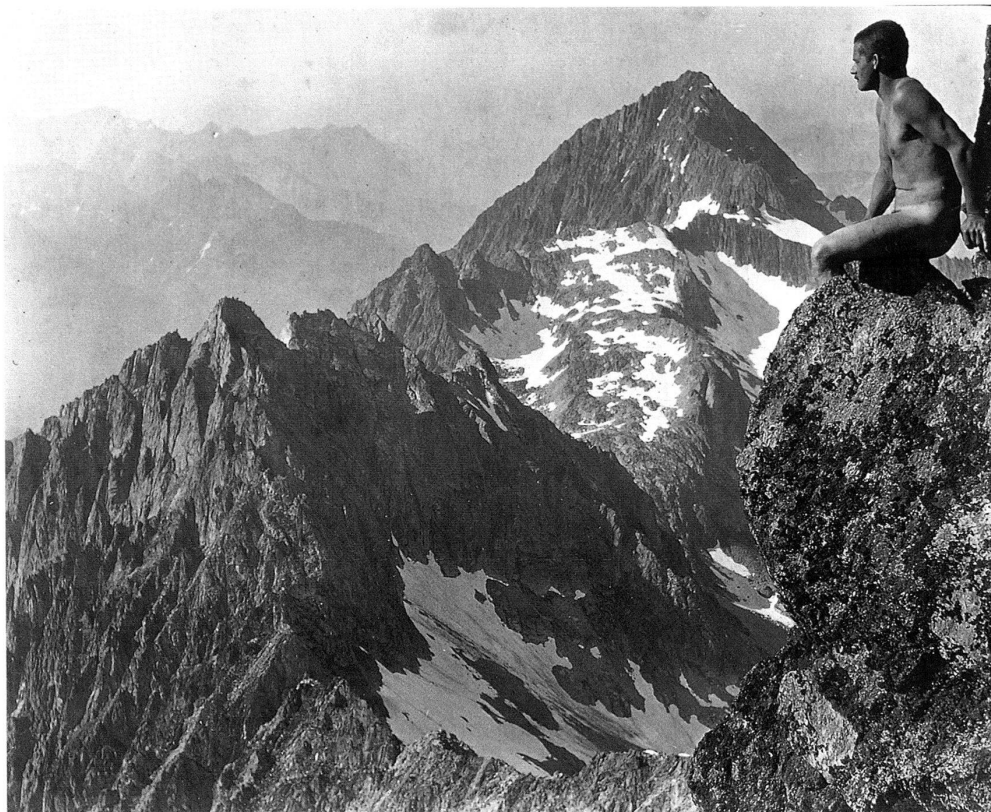
Ein Prometheus des frühen 20. Jahrhunderts, Berner Oberland (?), um 1920, Gelatinesilber-Abzug, 9,1×11,5 cm