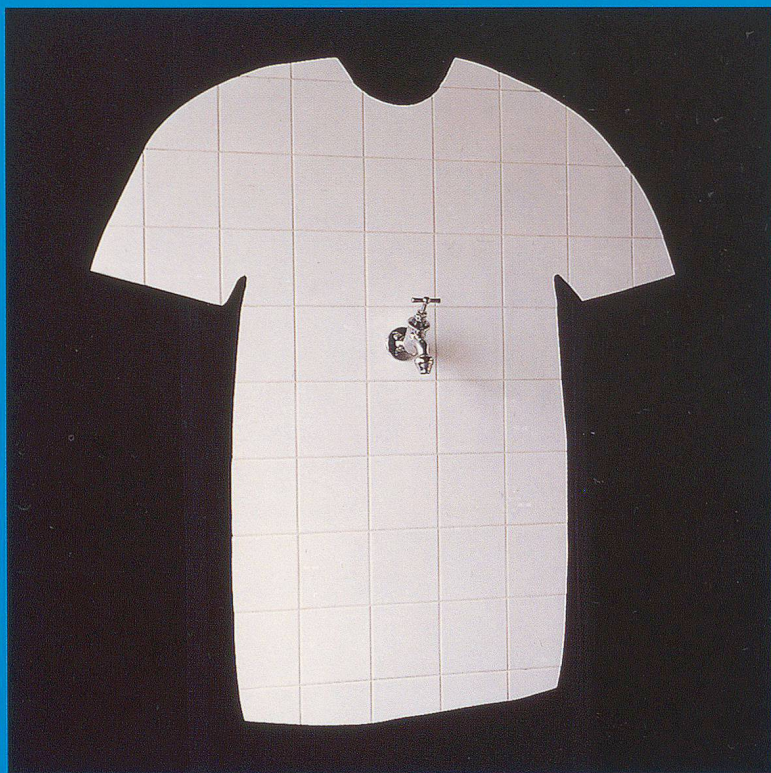
Dogan Firuzbay, «Der Kachelmann», 1998

...damit wir in Sachen Baukeramik den Hahnen aufdrehen können, wenn es um umfassende Beratung, um wegweisende Planung oder um anspruchsvolles Verlegen geht.