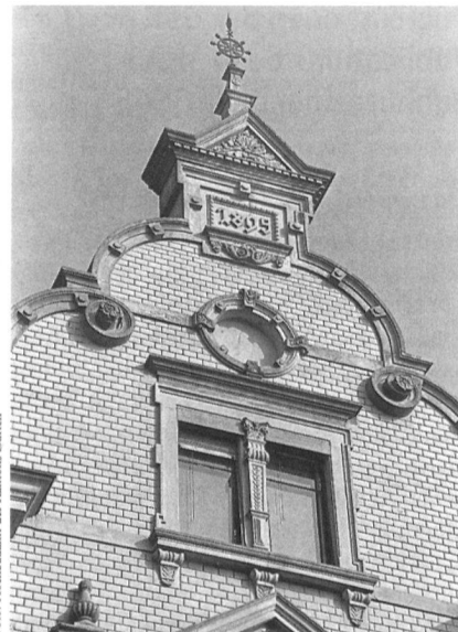
Küsnacht am Zürichsee, Giebel der Villa Hintermeister, 1895.

Katholische Pfarrkirche Mariä Himmelfahrt in Sagogn , Alfred Wyss, Gion Martin Pelican , 32 S., Nr. 610. – Die Kirche Mariä Himmelfahrt dominiert die Landschaft um Sagogn im Vorderrheintal.