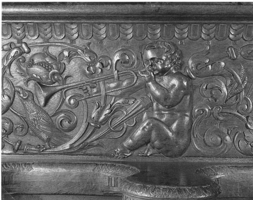
Ehemalige Zisterzienserklosterkirche Wettingen, posaunenblasender Putto mit Rabe, Relief an der südseitigen Brüstung des Chorgestühls, vermutlich von Christoph Fünffe, 1603/04.

À la mi-mai 1997, tous nos membres recevront les livres suivants: Les Monuments d'Art et d'Histoire du canton de Genève, volume I, La Genève sur l'eau comme don annuel 1997, ainsi que Die Kunstdenkmäler des Kantons Zürich, Band IX, Der Bezirk Dietikon , comme don annuel 1996/2.