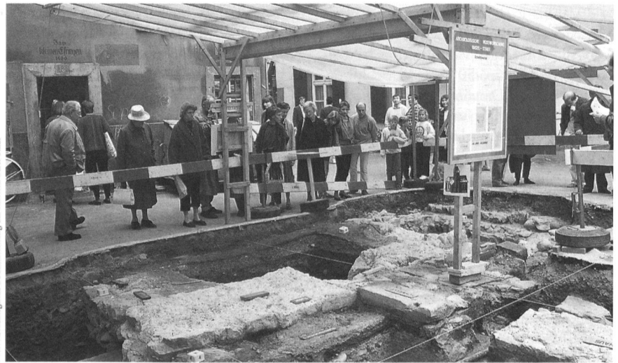
Basel, beim von der Archäologischen Bodenforschung organisierten «Tag des offenen Bodens» konnten Fundamentreste der Ende des 18. Jahrhunderts abgebrochenen Kirche unter dem Andreasplatz besichtigt werden.