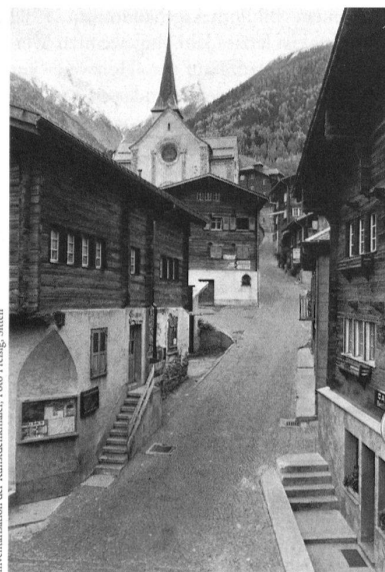
Blick vom Dorfplatz von Grenchols bei Ernen durch die Kirchgasse.

Die Kapelle St. Niklausen bei Kerns , Eduard Müller , 28 S., Nr. 588. – Die einzigarti-