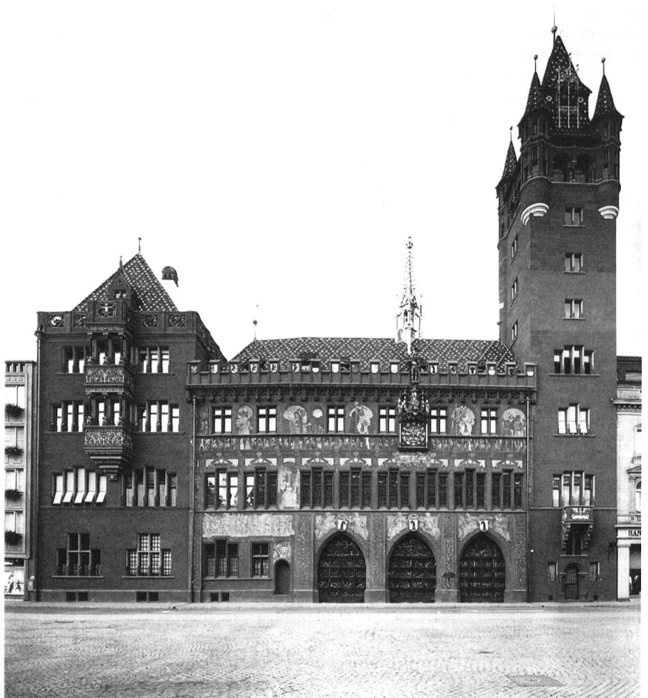
Basel, Rathaus, Marktplatzfassade, 1507/13, 1606/08 und 1898/1904.

Ihnen sei wärmstens empfohlen, die Ankündigungen und Kommentare in den Medien zu beachten und vom Tag der Kulturgüter zu profitieren. Fast durchwegs werden Sie die Gelegenheit bekommen, üblicherweise für das Publikum nicht zugängliche Objekte und Räume unter kundiger Führung besichtigen zu dürfen. Die Initianten werden darüber hinaus für alle Objekte illustrierte Unterlagen bereitstellen, die auf kurzweilige und verständliche Art Wissenswertes vermitteln und auf allerlei Merkwürdigkeiten aufmerksam machen. Regionale Schwerpunkte erlauben ohne weiteres, am selben Tag auch mehrere Objekte zu besuchen. Es bestehen also gute Aussichten auf einen erlebnisreichen Tag!