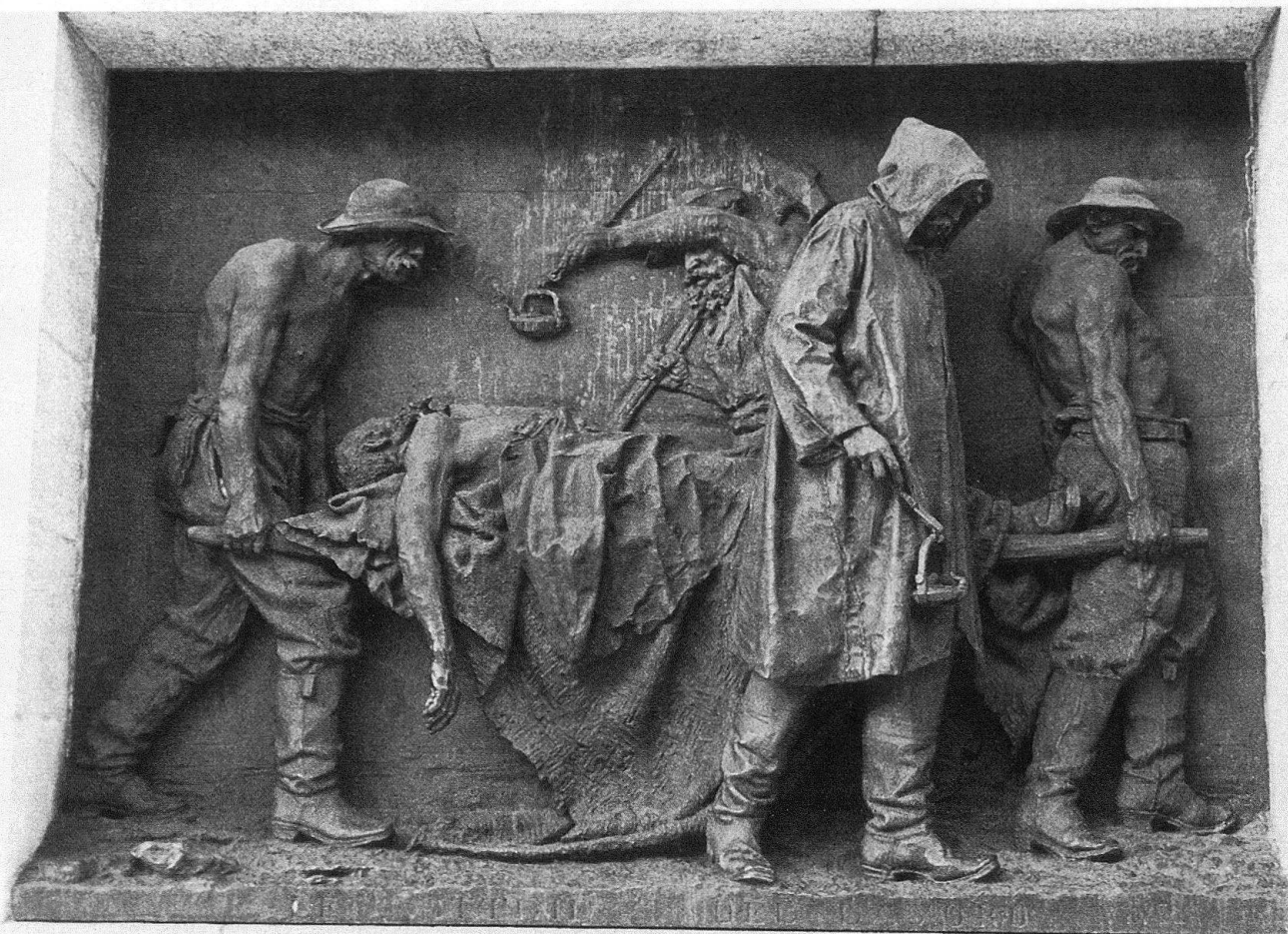
Vincenzo Vela, Le vittime del lavoro , 1932, bronzo, 244×327 cm. Airolo.