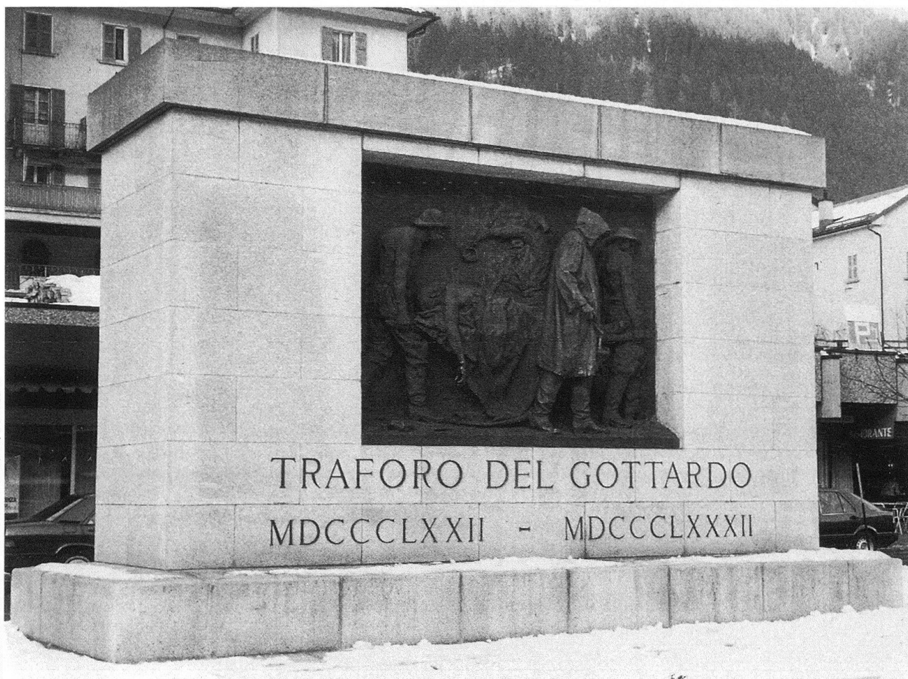
Vincenzo Vela, Le vittime del lavoro , 1932, Airolo.

posizione. Non a caso una delle fonti che ispirarono il Vela è un altro capolavoro dell'arte accademica e romantica dell'Ottocento italiano e ticinese, il Trasporto di Cristo al Sepolcro , dipinto tra il 1864 e il 1868 per il santuario della Madonna del Sasso di Locarno dal pittore ticinese Antonio Ciseri (1821-1891). La somiglianza iconografica (si veda l'analogia tra il Cristo e il minatore morto) e anche l'affinità spirituale tra le due opere, già notate dai critici dell'epoca, è notevole: sono due funerali, uno religioso l'altro volutamente laico che rispondono alla stessa volontà di raffigurare, attraverso il verismo delle espressioni, il dolore della morte.