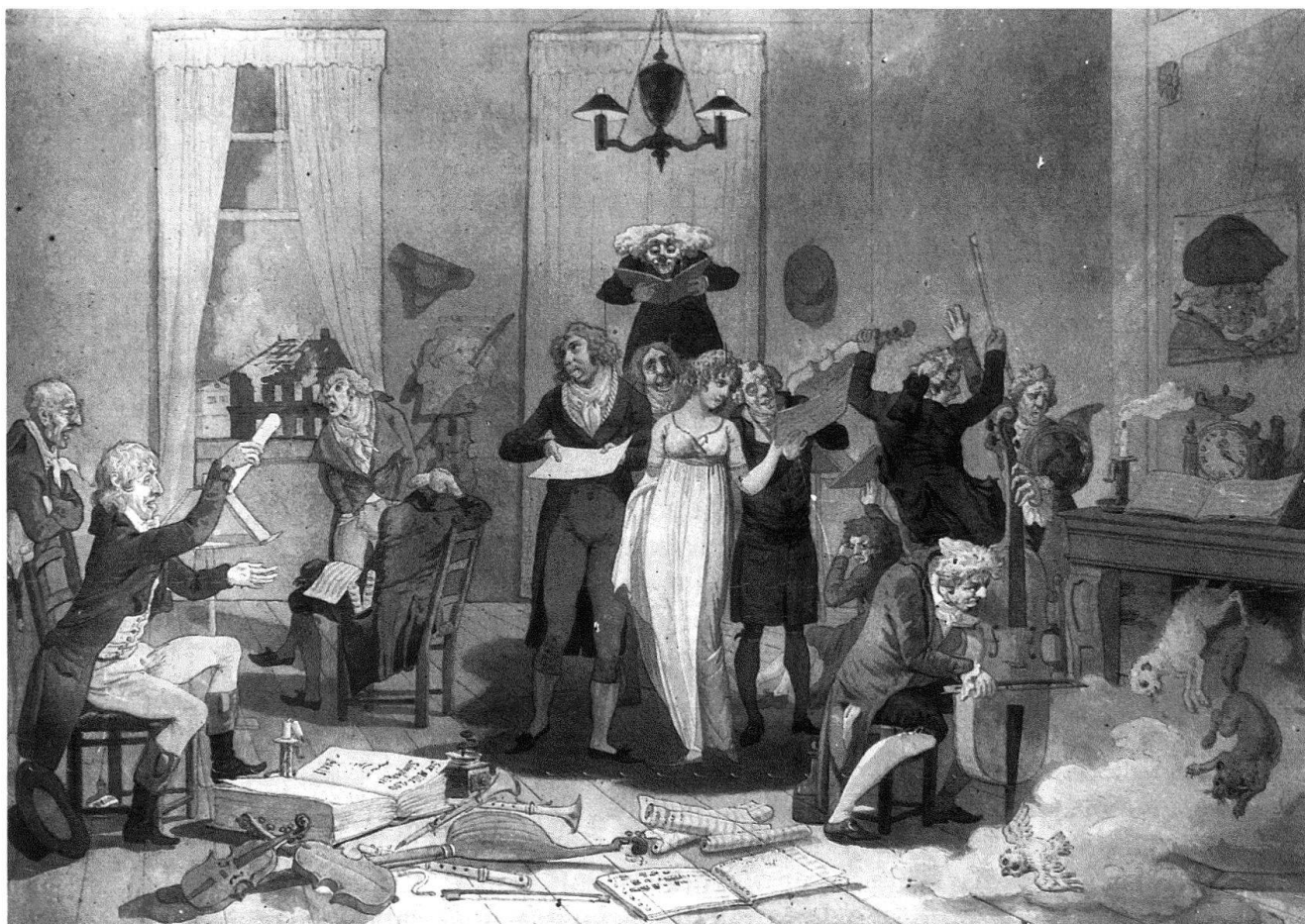
4 Le Concert d'Amateurs, env. 45×65 cm, aquarelle sur papier. Archives du Musée d'Art et d'Histoire, Genève. Provenance: ancienne collection Aimé Martinet. Avis de recherche: localisation actuelle inconnue.

quemment le trait de la plume. En revanche, les caricatures exposées en 1798 sont d'un dessin très méticuleux et réfléchi, qui est propre à la démarche de la caractérisation. Töpffer y fait preuve d'une très grande maîtrise de la technique de l'aquarelle, car même en observant ces aquarelles au microscope, on ne discerne pas de dessin sous-jacent. Ces «desseins à l'aquarelle» tels qu'ils sont décrits dans le catalogue d'exposition, participent d'une approche plus intellectuelle de la caricature, ce qui se manifeste aussi dans la perfection de leur exécution notamment par la précision du trait de l'aquarelle.