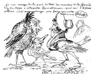
6 Bas-de-Lettre adressé à Sylvius Dapples, illustration provenant d'un catalogue de vente (Vente d'autographes à la Salle Thelusson, 17 rue de la Corraterie à Genève; vendredi 27 Janvier 1911). Avis de recherche: localisation inconnue.

Inutile de dire qu'Adam Töpffer est bien loin de défendre un quelconque système en matière de caricature, comme nous le montre un «bas-de-lettre» datant de 1797 dont la liberté d'expression se rapproche des drôleries en bas-de-page médiévales. Exécutée dans un graphisme linéaire que retiendra Rodolphe Töpffer, cette caricature fait partie d'une série intitulée «abus» 20 dont celui-ci est le numéro 78. Joyeux fouillis d'idées centrées sur le bruit de bottes – à quelques mois de l'annexion par la France – qui résonne alors particulièrement fort à Genève. L'écriture même de la lettre, dont la forme imite un baragouin suisse allemand, prolonge l'esprit irrévérencieux du dessin. Finalement, bien qu'elle ait été tronquée par les ciseaux de l'irrespectueux amateur qui en a découpé le dessin, nous reproduisons cette caricature verbale: «ochoutui cet in oter chour que ché le fait la continac.../letter qué che cricri à vou, warum voter brundar il été né.../sa voyache que il fait en la Savoie qué che sai pas quel.../alle warum que il me recardé in pitit moment et il s'enal.../sans dire a moua wo il ist gehen, vraisemblent que che lé.../davantache ici il ete retourné à la Losanne que vous fai... 21 »