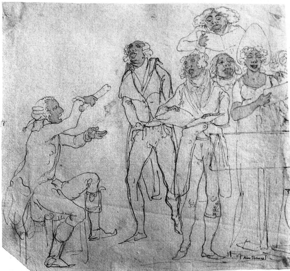
5 Esquisse pour le Concert d'Amateurs, 18,3×19,5 cm, plume et aquarelle sur papier vergé filigrané C&D Blauw, signé et daté en bas à droite: «Adam Töpffer '798». Collection privée.

le corps humain, tandis que Töpffer garde la face humaine – qui est sans contredit le domaine le plus fertile du caricaturiste – et «volatilise» les corps.