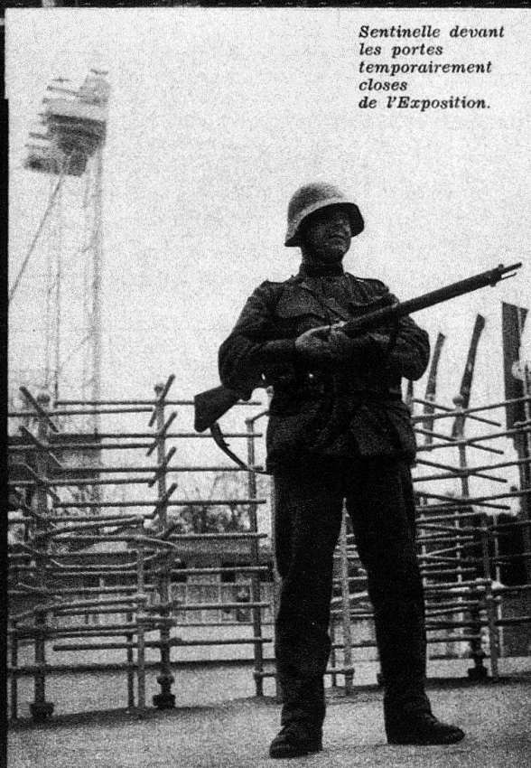
Sentinelle devant les portes temporairement closes de l'Exposition.

Jamais le peuple suisse ne fut plus uni!