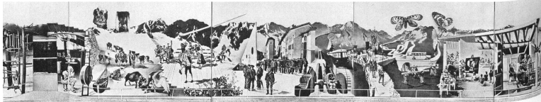
2 Hans Erni, «La Suisse, pays de vacance des peuples», peinture monumentale réalisée pour l'Exposition Nationale Suisse en 1939 (5 m x 91 m).

Par ailleurs, durant toute la période, l'attitude de la Suisse avait tendu à s'adapter avec souplesse en fonction des grands événements de l'histoire mondiale. En 1940, après la victoire de l'Axe, la Suisse avait offert ses capacités économiques et financières aux vainqueurs. Après Stalingrad et face à une pression plus insistante des Alliés, notamment des Américains, elle commence à se détacher prudemment des Allemands. A la fin de la guerre, la menace des listes noires établies par les Américains contre des entreprises helvétiques engagées dans le commerce avec les Allemands exige un rapprochement rapide à l'ordre des nouveaux maîtres. Finalement, grâce à différents traités, la Suisse réussit à se placer dans le sillage de l'impérialisme américain. L'accord de Washington (1946) par exemple, ainsi que l'entrée dans l'Organisation européenne de coopération économique (1948) et l'accord Hotz-Linder (1951) vont intégrer de fait la Suisse dans le système d'embargo mis en place par les Etats-Unis contre l'URSS. Une nouvelle parole officielle de la diplomatie helvétique voit alors le jour. Connue sous les termes de «neutralité et solidarité», cette dernière ne recouvre pas toujours les actes concrets qui accompagnent cette ouverture.