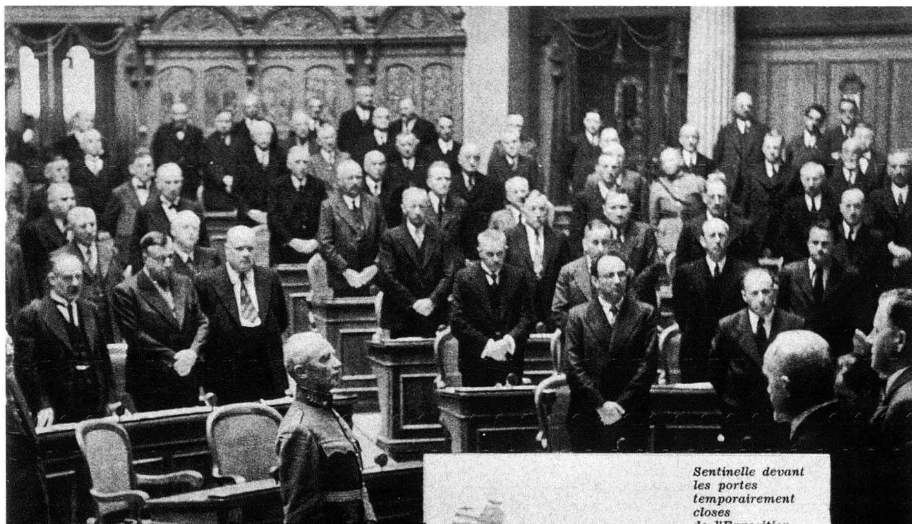
L'assermentation du Général devant l'Assemblée Nationale.