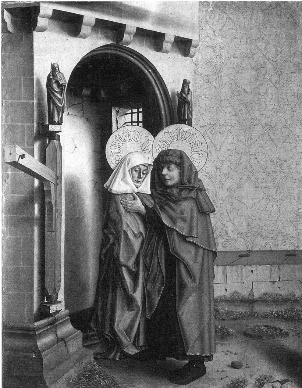
3 Konrad Witz, Begegnung von Joachim und Anna unter der goldenen Pforte, wohl vom Anfang der vierziger Jahre des 15. Jahrhunderts.