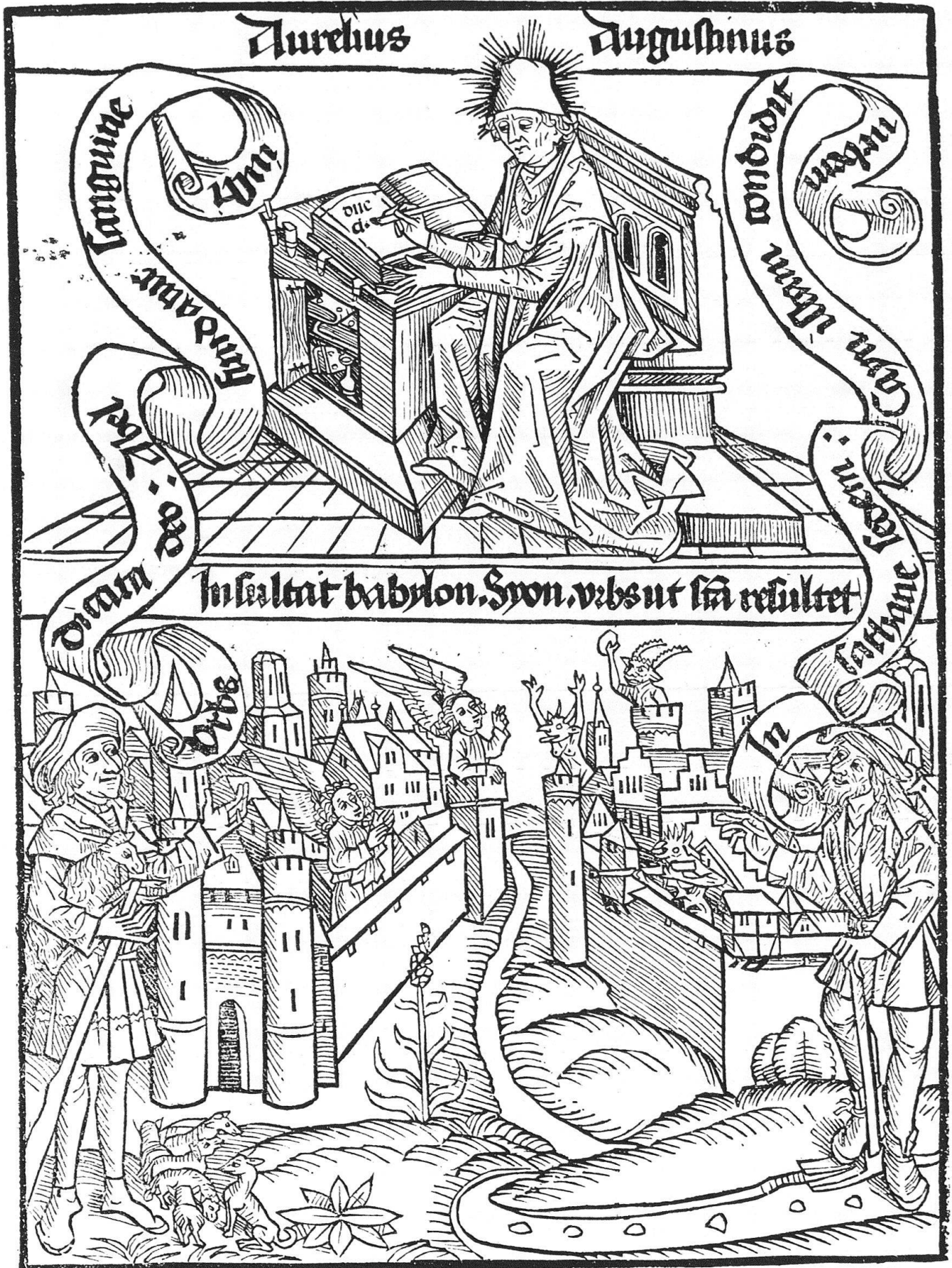
4 Basel, erkennbar am Spalentor, als Stadt Gottes im Kampf gegen die Stadt Satans. Holzschnitt auf dem Titelblatt zu Augustins «Civitas Dei» aus der Offizin von Johann Amerbach, Basel 1489. Universitätsbibliothek, Basel.