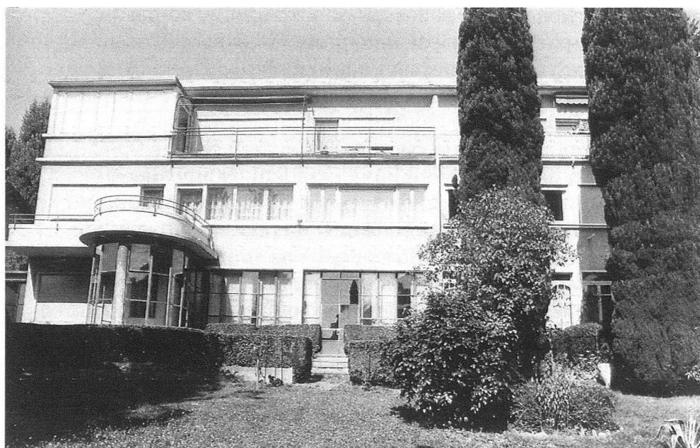
7 La façade sud-ouest avec l'adjonction de vitrages au rez-de-chaussée et d'une véranda sur le balcon supérieur.

A l'aboutissement de notre incursion dans cet exemple du patrimoine lausannois de l'architecture moderne, nous avons certes pu constater l'importance des modifications dues, dans une large mesure, aux dégradations subies par ces constructions au cours du