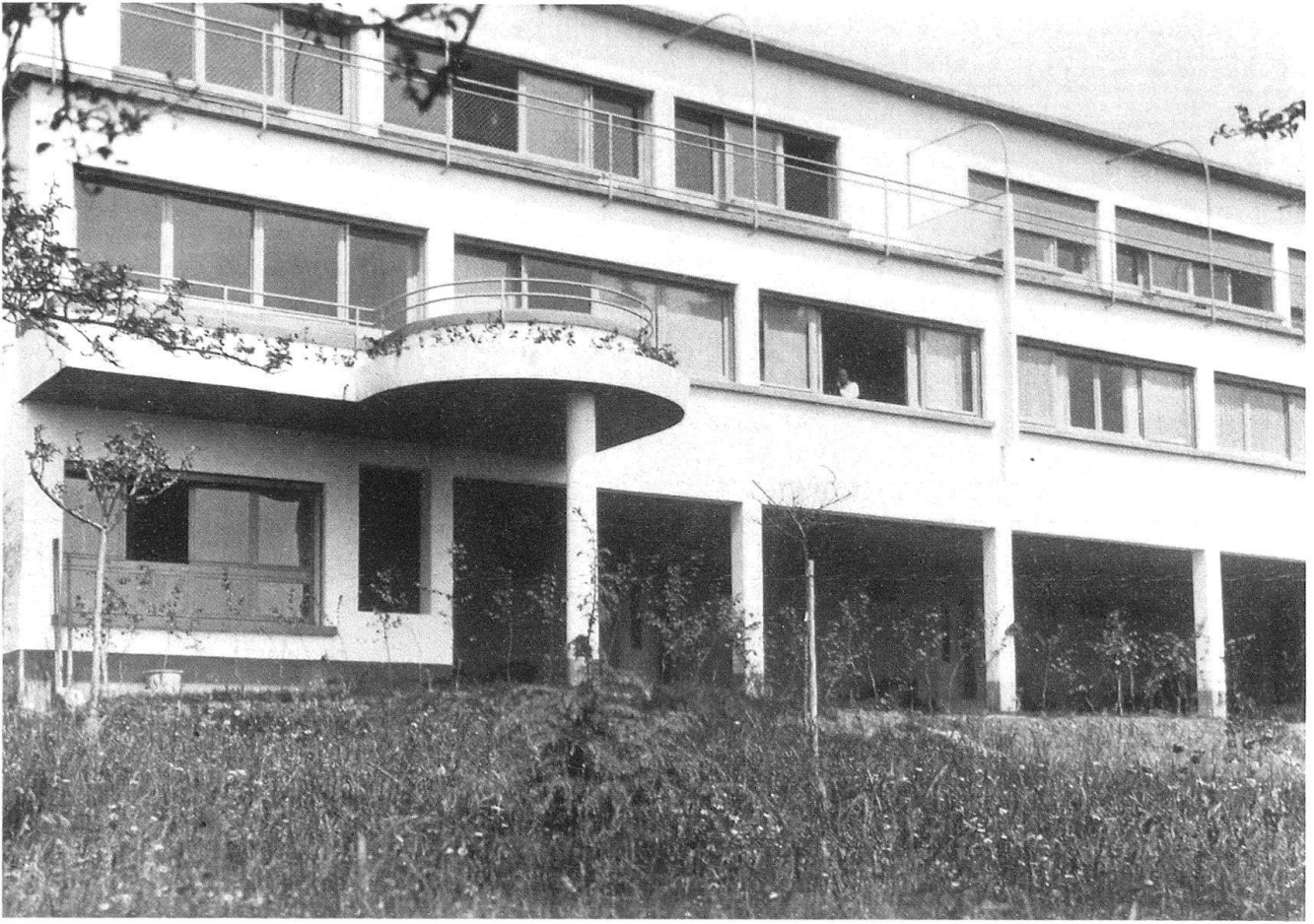
4 Vue sud-ouest des maisons en 1930. Le rez-de-chaussée avec ses terrasses couvertes.

nomiques certes, mais n'oublions pas qu'en pleine euphorie du mouvement rationaliste, Le Corbusier venait de construire cinq ans plus tôt, sa «Petite maison» sise au bord du Lac Léman. Suivant ses théories de la «machine à habiter», Le Corbusier ne définissait-il pas justement: «Des fonctions précises avec des dimensions spécifiques pouvant atteindre un minimum utile...»? Sa petite maison de Corseaux atteignait tout juste soixante mètres carrés.