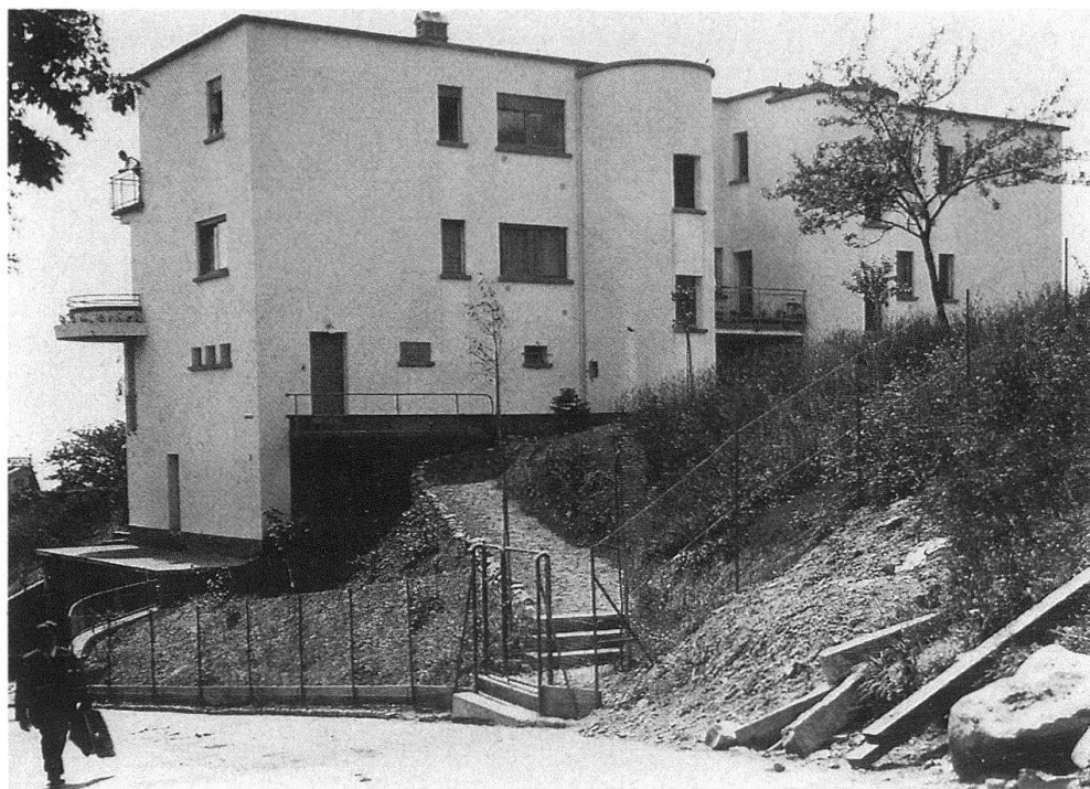
2 Vue nord-est en 1930, avec l'entrée commune et les cages d'escalier indépendantes.

mentation, tant iconographique que technique. Cela est assez rare pour être signalé et explique également les raisons de notre choix.