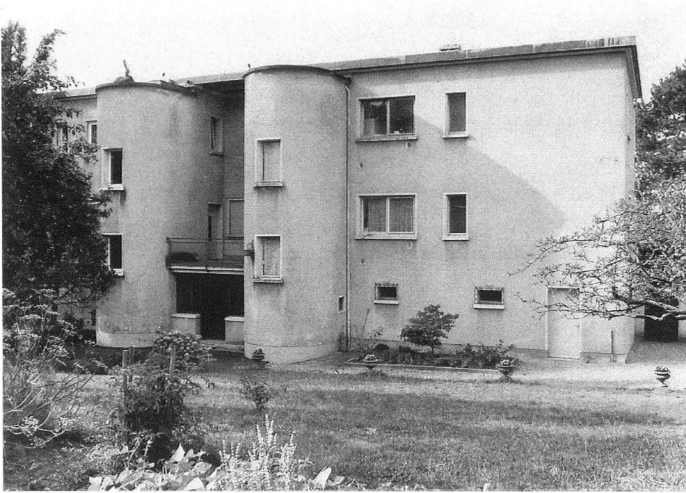
3 Vue actuelle de la façade d'entrée. On remarque l'importance de la nouvelle toiture, réalisée en 1947.