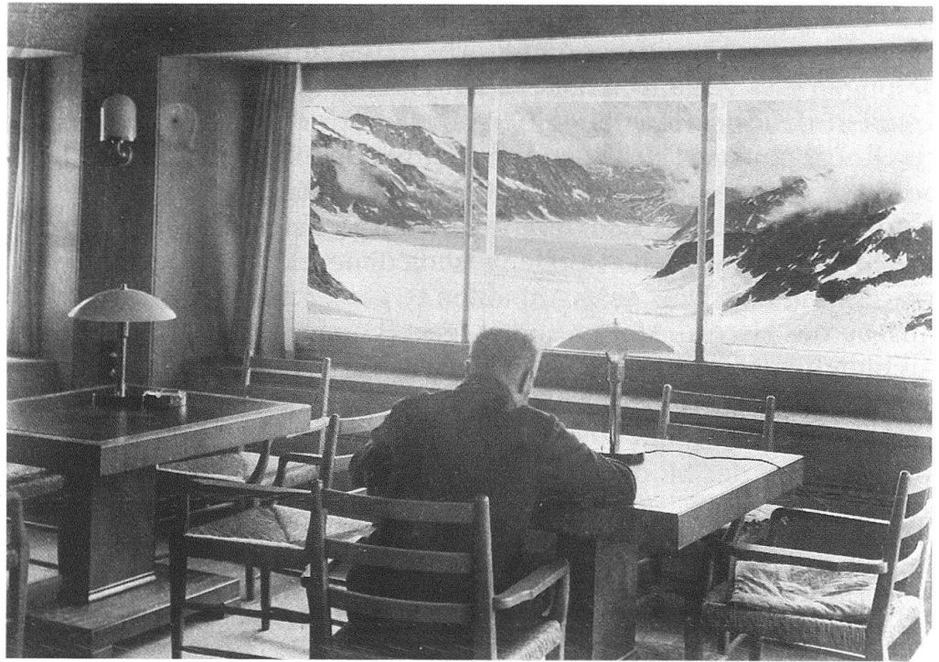
4 Hochalpine Forschungsstation Jungfrau-joch, Bibliothekraum mit grossem Panoramafenster. Fotografiert im Juli 1936.

ist vom Terrainverlauf bestimmt. Alle Gebäudeteile haben mit Granitplatten belegte Flachdächer: Ein gerade für die heutige Architekturdiskussion äusserst bemerkenswerter Aspekt, wie der neuerdings wieder aufflackernde Ästhetikstreit um den Stellenwert des Flachdaches im Orts- und Landschaftsbild zeigt!