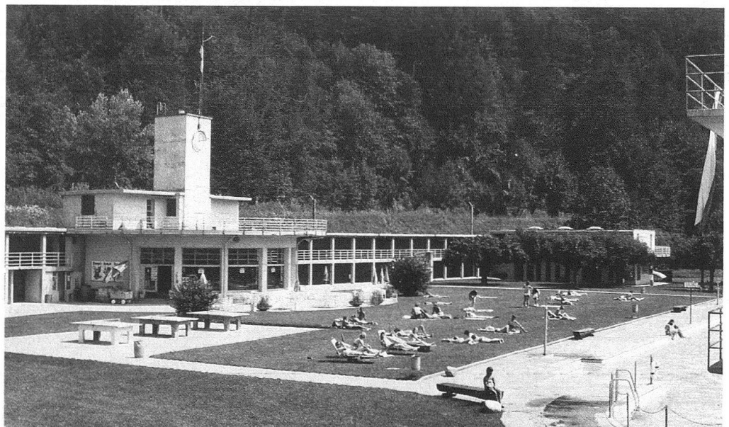
5 Strandbad Interlaken, fotografiert im Sommer 1986. Restaurant und Garderobetrakte lassen noch weitgehend den Originalzustand erkennen.

Das Strandbad Interlaken wurde 1930 nach Plänen der Interlakner Architekten Urfer, Stähli und Mühlemann gebaut. Es ist das grösste und zugleich früheste der Schwimm- und Sonnenbäder, die zur Zeit