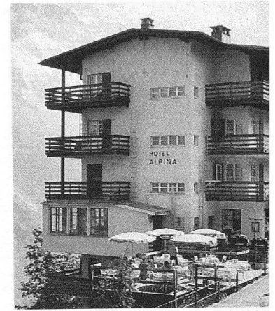
2 Das aufgestockte Hotel «Alpina» mit aufgestülptem Satteldach, fotografiert 1986.