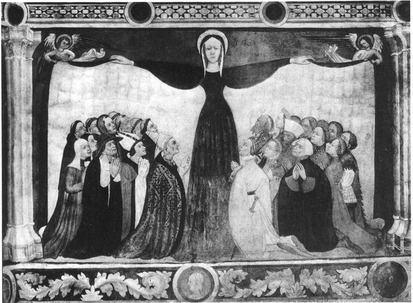
1 Château de Fénis, fresques de la chapelle (vers 1410–20): la Vierge de miséricorde.

presque identiques s'explique en partie par les pratiques propres à l'art du 15 e siècle. Celles-ci font une large place aux modèles recueillis sous forme de carnets de dessins et d'esquisses 12 . Le commanditaire a choisi un peintre d'origine piémontaise associé à l'art prestigieux de la cour de Savoie et valorisé par sa maîtrise d'une technique difficile, dont le registre stylistique est pourtant archaïsant 13 . Le choix indique une stratégie reposant sur des références aux valeurs passées dont l'enjeu est certainement la reconnaissance sociale.