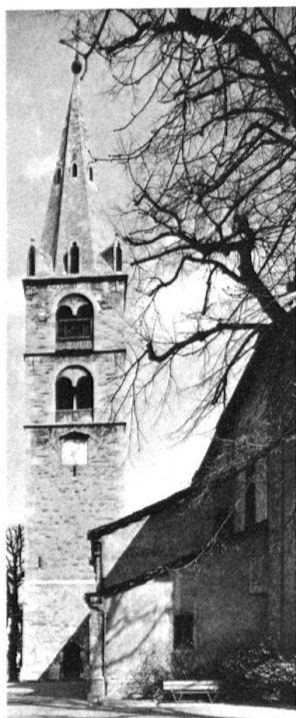
5 Martigny, église paroissiale: clocher (1715-1720).

cette forme d'ouverture s'est propagée dans les régions alpines à partir du XVII e siècle principalement 22 .