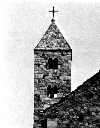
3 Sion, chapelle de Tous-les-Saints (vers 1323-1325), clocher.