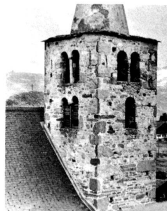
2 Nax, clocher de l'église paroissiale: fenêtrages (XV e s.?).

Suggérée par la disposition du XVIII e siècle, qui a pu s'inspirer de la construction préexistante, une dernière hypothèse consiste à se demander si, au XIV e siècle déjà ou même avant, les baies jumelées n'étaient pas comprises dans un arc en plein-cintre, d'un modèle courant en Italie romano-gothique. Il faut toutefois rappeler que