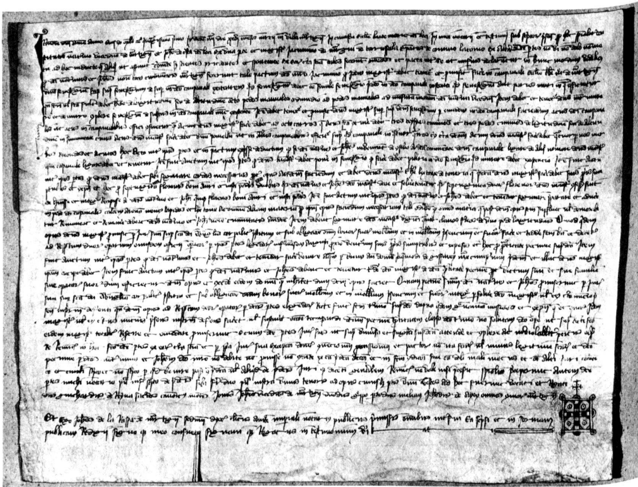
1 Convention du 26 mars 1351 pour le remaniement du clocher de Martigny. Sion, Archives cantonales, Martigny-Mixte, n° 834. Parchemin original.

l'ouvrage et l'extraction du tuf à la carrière ( trahere lex toux de toueria ) incombent au maître.