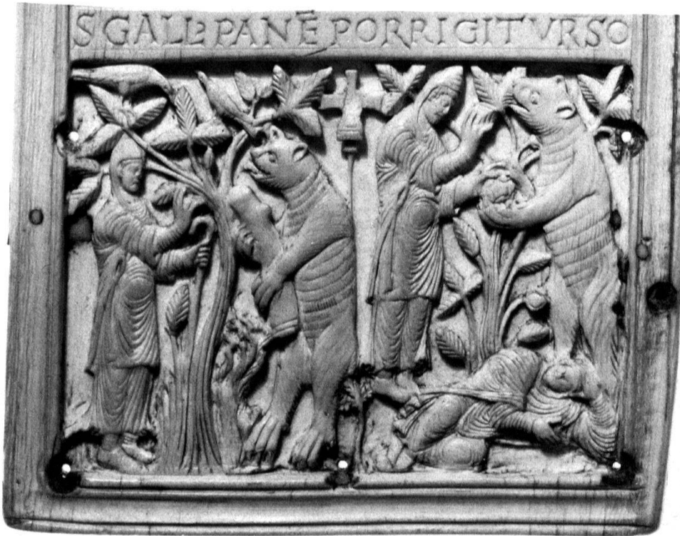
1 St. Gallen, Stiftsbibliothek, Codex 53, Elfenbeinrelief des Hinterdeckels.

herrschenden Künstler vorstellte und der dazu noch angenehm im Umgang, eben «im Ernst und im Scherz unterhaltlich» zu sein hat – «serio et ioco festivo». Dass seine Hand von göttlicher Inspiration geleitet war, wie dies Ekkehard im 45. Kapitel der Casus berichtet 13 , gehört zu den literarischen Topoi, vermag uns aber das in Worten schwer fassbare Besondere des Frontispizbildes im Goldenen Psalter erklären helfen: