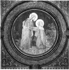
5 La visitation. Médail- lon du plafond de la nef de Planfayon peint en 1909.

passé par simple conformité au goût de l'époque. A des degrés divers, ils s'inscrivent tous, comme nous le verrons, dans le courant de l'éclectisme créatif 15 .