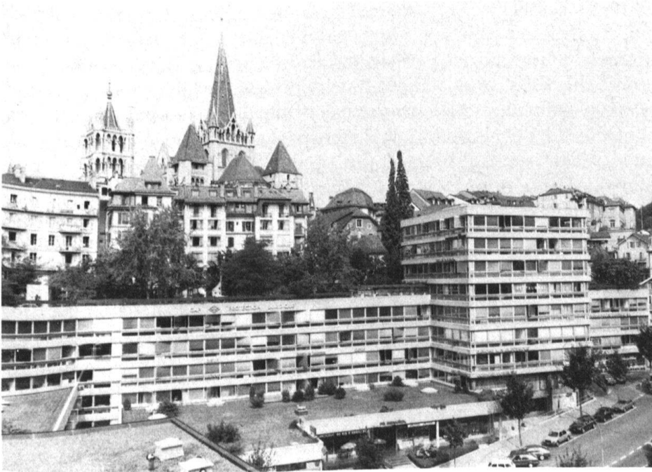
5 Le centre historique dans son corset du XX e siècle, alors qu'en tant que tel, il n'a jamais reçu les honneurs d'une définition organique, sociale ou même culturelle de son périmètre.

politique, ni la révolution radicale de 1845, ni la montée socialiste et communiste en 1934 n'arriveront à modifier le processus de «désorganisation urbaine» amorcé par la bourgeoisie locale à l'aube de l'indépendance vaudoise. Aujourd'hui, le partage du pouvoir entre la gauche et la droite nous laisse percevoir une entente souvent tacite ou des compromis dans la bonne tradition vaudoise. Mais que s'est-il donc passé au niveau des pouvoirs qui se sont succédé depuis bientôt deux siècles pour que tant d'abnégation de leur part, engendre le laisser-faire, la politique des petits pas et l'anarchie urbaine? Que s'est-il passé au niveau des mentalités, tant au niveau des autorités locales que de la bourgeoisie possédante ou des milieux intellectuels, pour que l'espace urbain lausannois ait été laissé à la dérive? Avons-nous été et serions-nous toujours à la merci des «délires d'une politique» ou plutôt à l'aube d'une «conscience populaire à la recherche de son identité»?