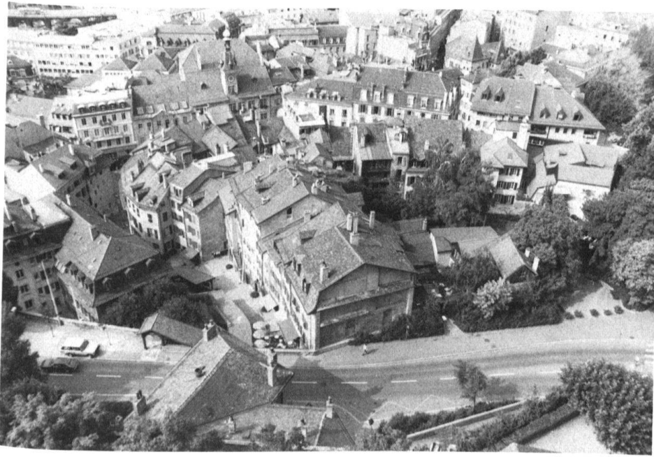
3 Les entailles routières dans le tissu ancien et les maigres restes du centre historique. Dans les années cinquante encore, des maniaques de la fluidité du trafic projetaient d'en grignoter une partie.

veloppement, ses constructeurs aient si peu tiré parti du site le plus extraordinaire et le plus enviable que l'on puisse imaginer. Il ne s'agit pas de refaire l'histoire urbaine de Lausanne, mais plutôt d'aborder certains des aspects les plus déconcertants des conditions de son développement depuis près de deux siècles.