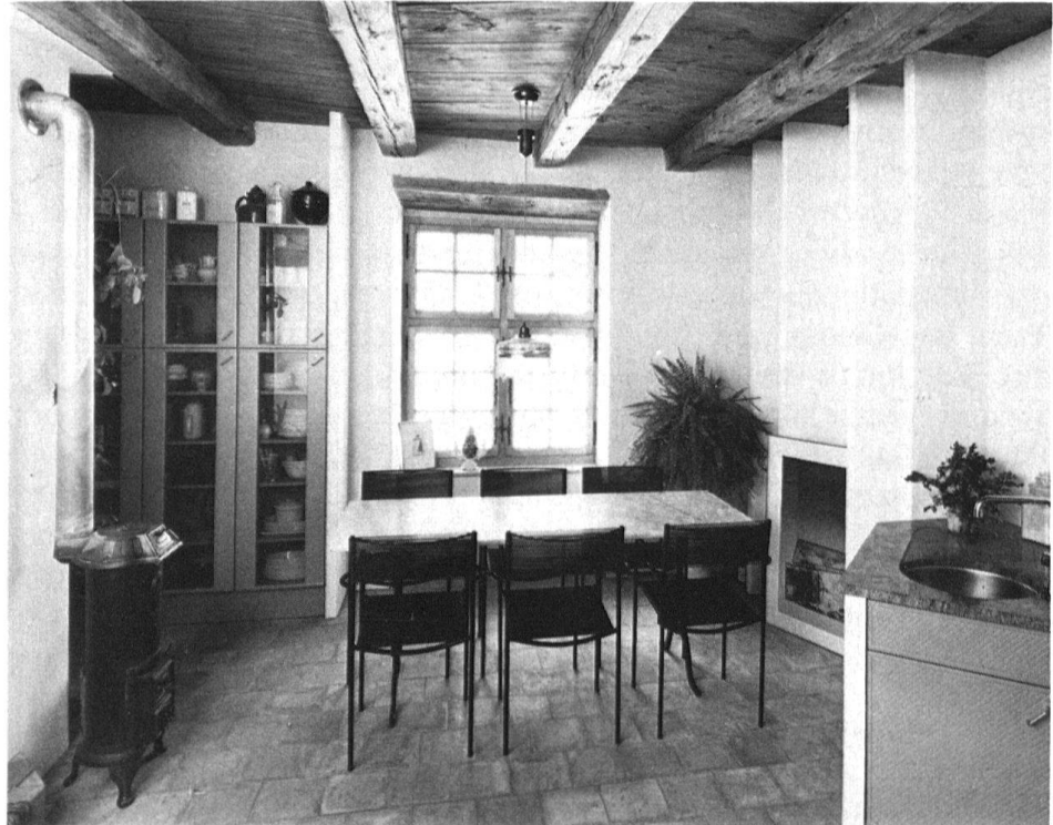
5 Mettmenstetten, Wohnhaus im «Buch- stock». Neu eingerichtete Wohnküche als Ersatz der alten Hausküche.

hier lief alles vorstellungsgemäss. Bereits in einem vorausgegangenen Grundsatzgespräch hatte die kantonale Gebäudeversicherung der Denkmalpflege versichert, dass Brandschutzmassnahmen dem Schutzziel überkommener Objekte nicht zuwiderlaufen sollten, sofern der Personenschutz gewährleistet sei. Die Festlegung konkreter feuerpolizeilicher Massnahmen zwischen Gebäudeversicherung, Denkmalpflege und Bauherrn brachte dann im «Buchstock» den erhofften Erfolg: das hölzerne Treppenhaus und die Holzdecken in den wichtigsten Räumen einschliesslich die Küche gehören zum integralen Bestand und sind sichtbar zu erhalten. Die Auflagen beschränkten sich in der Folge auf wenige grundsätzliche Massnahmen, die baulich zu realisieren waren (feuerdämmende Einbauschichten in den ohnehin zu erneuernden Zwischenböden u.ä.).