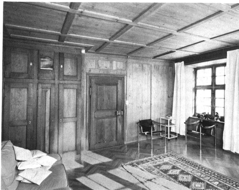
6 Mettmenstetten, Wohnhaus im «Buchstock». Täferstube mit originalen Teilen, restauriert und neu eingerichtet.

weitgehend erhalten. Lediglich der hofseitige Hauseingang musste wieder ins Hochparterre verlegt und die Freitreppe (deren Geländer im Dachraum aufgefunden wurde) neu erstellt werden. Auf die Forderung des Architekten, im Rahmen des Wärmekonzeptes die alten Fenster durch Isolierverglasungen zu ersetzen, ging die Denkmalpflege ein, als von einer Spezialfirma eine eigens dafür entwickelte Ausführung vorgelegt werden konnte, die dem ursprünglichen Eindruck der Kreuzstockfenster weitgehend entsprach.