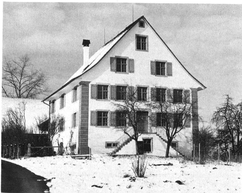
2 Mettmenstetten, Wohnhaus im «Buch- stock» nach der Restaurierung 1983.

hend der Ganzholz- bzw. der Fachwerkbauweise verpflichtet war, hat ein massiver Steinbau an sich den Charakter des Aussergewöhnlichen. Besitzt er aber dazu noch bauliche Merkmale, die in der Zeit sicher als modern, unüblich und zugleich herrschaftlich eingestuft worden sind, dann muss hinter dem Bauwerk ein gesellschaftlicher Hintergrund vermutet werden, der den Bauherrn damals nicht nur wirtschaftlich, sondern auch von seinem gesellschaftlichen Status her befähigte, den Charakter des Ungewöhnlichen offen zur Schau zu stellen. Nur Angehörigen der städtischen Herrschaftsschicht und Vertretern der dörflich-ländlichen Führungsgruppe waren im Ancien Régime derartige Manifestationen möglich. Erstere fallen im Knonaueramt weitgehend weg. Stadtbürgerliche Landsitze und herrschaftliche Wohnbauten gab es hier (mit Ausnahme der Pfarrhäuser und des Schlosses in Knonau) nicht.