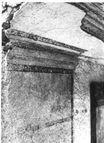
3 Mettmenstetten, Wohnhaus im «Buchstock». Ecklisenenmalerei (wohl von 1792/93) im Originalzustand.

Oberschicht damit eine zusätzliche Vertrauensposition. Wir können an einzelnen Beispielen verfolgen, wie die Gruppe der Textilfergger sich schliesslich zur neuen Fabrikantenschicht des liberalen 19. Jahrhunderts aufgeschwungen hat. Die wirtschaftliche Emanzipation dieser Schicht hat nachweislich in den letzten beiden Jahrzehnten des 18. Jahrhunderts in der Lockerung des städtischen Gewerbe- und Handelsmonopols eingesetzt. Die erste Generation der wirtschaftlichen Emanzipation auf dem Lande war zugleich auch die neue politische Führungsschicht (Stäfener Handel, Ustertag). Sie hat sich aber sogleich auch baulich manifestiert. Einzelne dieser Privatbauten einer verheissungsvollen Übergangszeit zwischen 1780 und 1810 haben sich erhalten. Durch ihre bauliche Auszeichnung gehören sie heute fast durchwegs in die Liste überkommener Schutzobjekte. Es ist deshalb naheliegend, den vordern «Buchstock» dieser ländlichen Führungsschicht zuzuordnen.