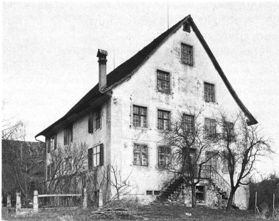
1 Mettmenstetten, Wohnhaus im «Buch- stock» vor der Restaurierung, Zustand 1983.

Zerfall preisgegeben schien. Wie in vielen Fällen hat erst ein entscheidender Handwechsel die Bewahrung dieses Privathauses von kantonaler Bedeutung ermöglicht.