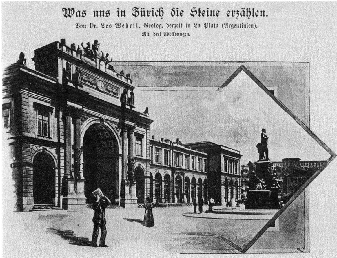
Abb. 3. Publikationen zu geologischen Spaziergängen auf Stadtgebiet: Aufsatz «Was uns in Zürich Steine erzählen» von Leo Wehrli in der Zeitschrift «Die Schweiz», 1897

ausgerlesenen Steinsorten schmücken die 1889–1891 erstellte Unionbank am Oberen Graben: Eingangssäulen aus rotem schwedischem Granit, 27 Pfeiler von grauweissem Granit aus dem Fichtelgebirge in Nordbayern (Vestibül, nicht erhalten), 18 Säulen im Schalterraum aus norwegischem Labradorgranit sowie deren Postamente aus Karst- marmor von Santa Croce bei Triest (nicht erhalten) 10 . Nicht in seinen geologischen Rundgang einbezogen hat Allenspach die 1885–1887 nach Plänen von Johannes Voll- mer, Berlin, erstellte St.-Leonhards-Kirche, für die rund 20 verschiedene Gesteine und Kunststeine verwendet wurden 11 .