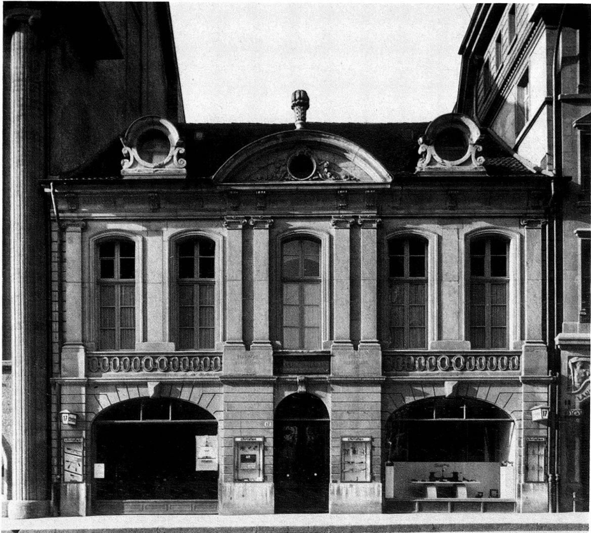
Abb. 2. Bern, Rathaus des Äusseren Standes. Die Fassade an der Zeughausgasse vor der Restaurierung