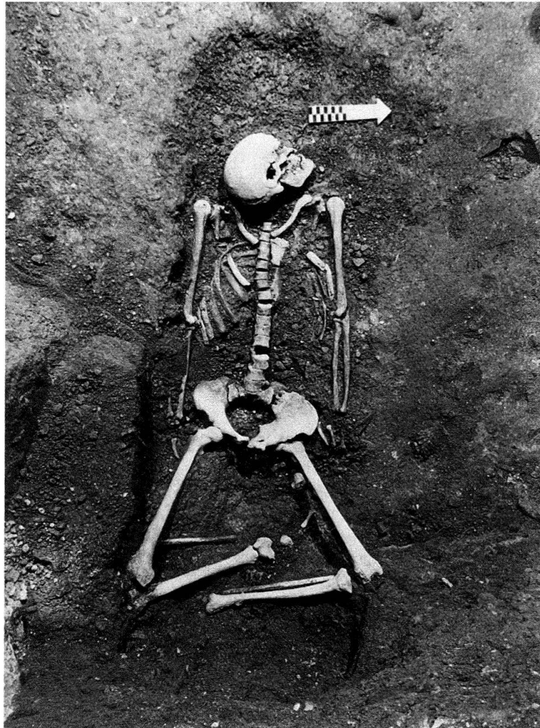
Abb. 5. Kloster Einsiedeln. Bestattung in der Nordwestecke der romanischen Kapelle: Skelett in situ

Möglicherweise handelt es sich bei diesen Gräbern um zwei örtlich (vgl. Abb. 1) getrennt bestattete Familien(?)gruppen; für einen eigentlichen Friedhof ist die Bestattungsdichte zu gering. Die Männer sind von erheblicher Körpergrösse und überragten mit über 171 cm wohl die meisten ihrer Zeitgenossen.