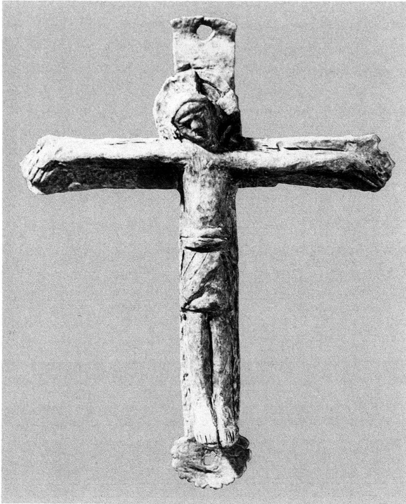
Abb. 4. Kloster Einsiedeln, Chor. Beigabe in einem Kindergrab: romanischer Kruzifix aus Blei; Korpus 9 cm hoch

Der kleinere Kruzifix (Korpus 3,9 cm) besteht aus Bronze und ist mit Fäden an ein Kreuzchen aus Weisstanne geheftet. Die Blockhaftigkeit des in Symmetrie erstarrten Korpus weist das Werk ins späte 12. oder frühe 13. Jahrhundert.