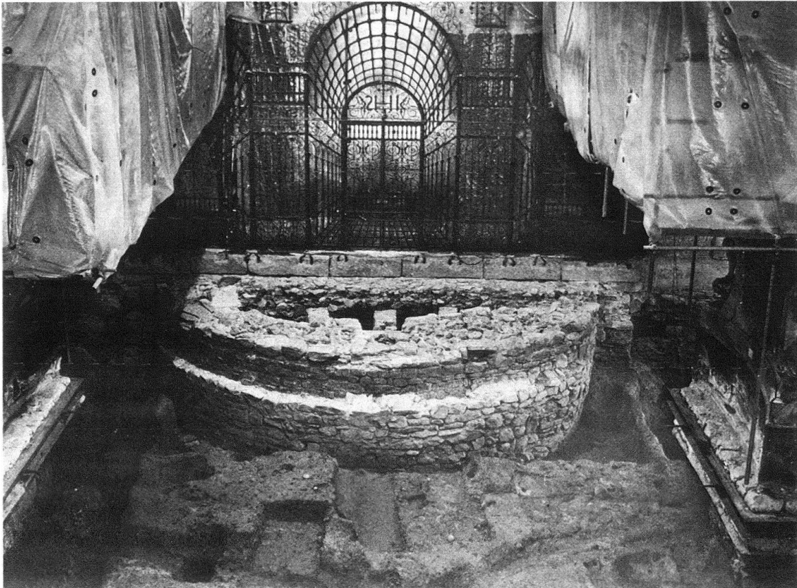
Abb. 2. Kloster Einsiedeln, Chor. Blick nach Westen gegen das Chorgitter. Romanisches Krypten-Halbrund mit stark vortretendem oberem Vorfundament

gruft unter dem Schiffboden deckt sich vermutlich ziemlich genau mit dem Westteil der romanischen Krypta (nicht ergraben). Der Mauercharakter der Krypta sowie Überlegungen zur baulichen Entwicklung des Klosters machen es wahrscheinlich, dass die freigelegten Bauteile zu derjenigen Klosteranlage gehören, die nach dem urkundlich überlieferten Brand von 1029 unter Abt Embrich errichtet und 1039 geweiht worden war.