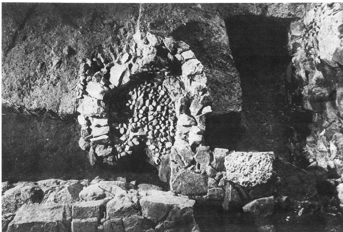
Abb. 3. Kloster Einsiedeln, Chor-Südwestecke: sekundär an eine Mauerecke (links unten) angefügte Apsidiole (10. Jh. ?); im Nischenhalbrund Kieselrollierung als Unterlage zu einem Mörtelboden

Älter als das System offener Gräben sind zwei Holzbauten im Norden und Süden unter dem heutigen Chor. Holzreste blieben zwar nicht erhalten, doch sind mehrere Gruben als dunklere Verfärbung im anstehenden gewachsenen Erdmaterial erkennbar. In den Gruben müssen ehemals die Schwellbalken der Bauten gelegen haben. Die genaue Ausdehnung der beiden Häuser bleibt offen. Erkennbar ist aber, dass sie einen leicht trapezförmigen, nach Westen offenen Hof umschliessen. Ungefähr in Hofmitte fand sich eine brandgerötete Grube, die sich an eine aus Steinen gefügte Quermauer