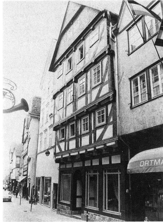
Marburg, Barfüßerstrasse 27. Städtisches Fachwerkhaus um 1600 mit vorkragenden Stockwerken. Während und nach der Sanierung, wobei die barocke Marmorierung der Balken von etwa 1700 erhalten werden konnte

im Sinne der Pflege und Revitalisierung historisch gewachsener Ortsstrukturen oder, wo die Bestandserhaltung in situ nicht geht, die museale Bewahrung bautypischer und/oder kulturhistorisch wertvoller Gebäude z. B. in Freilichtmuseen.