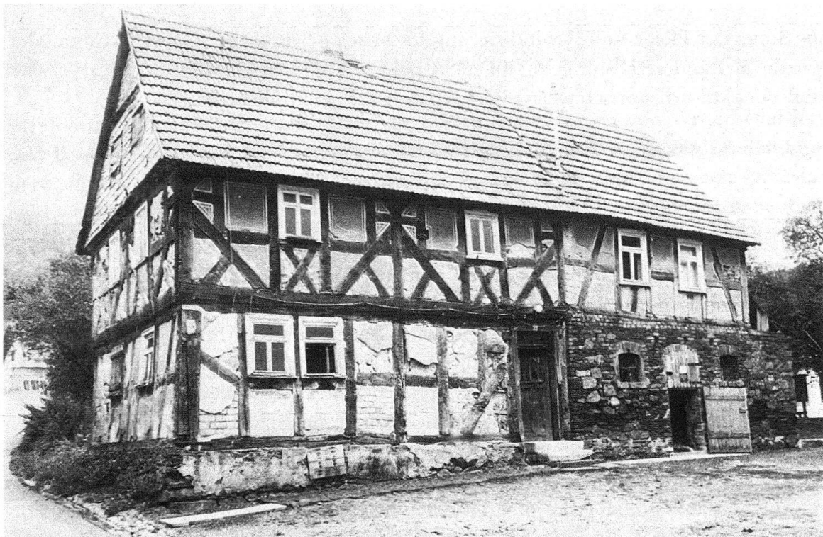
Bellnhausen, Lanzenbacherstrasse 33. Ländlicher Fachwerkbau vom Anfang des 18. Jh. mit 3 Zonen (von l. nach r.): Stube, Ern (= Flurteil) und Stall, massiv erneuert. Ursprünglich war das Haus nur zweizonig, was an der Dachnaht noch sichtbar ist

Das Programm der Marburger Tagung, die vom 1. bis 4. September 1981 stattfand, hatte zwei inhaltliche Schwergewichte, zum einen die wissenschaftliche « Inventarisierung und Dokumentation », zum anderen die praktische « Sanierung von Altstädten ». Marburg im Hessenland ist als Tagungsort gewählt worden, weil es in beiden Bereichen Vorbildliches geleistet hat und noch leistet.