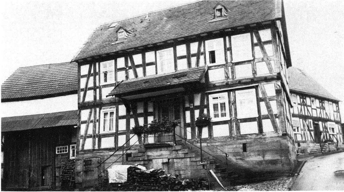
Ebsdorf. Ländliches Fachwerkhaus von 1857 auf hohem Sockel (Keller) mit Freitreppe als barock-«herrschaftliches» Architekturzeichen. Ebenfalls dreizonig: Erdgeschoss mit 2 Stuben und mittlerem Ern, Obergeschoss mit Kammern. Der Stall links befindet sich im Sockelteil

Es gibt am Ort zwei aus studentischen Kreisen initiierte Arbeitsgruppen, die im Auftrag des Stadtplanungsamtes inventarisatorisch die Marburger Altstadt, die noch heute überwiegend aus Fachwerkbauten besteht, wissenschaftlich erforschen. Die Arbeitsgruppe für archäologische Bauforschung untersucht die in Sanierung befindlichen Altstadt Häuser, um an den Objekten selbst Aufschluss über die geschichtliche Entwicklung des Wohnens und der Nutzungen zu gewinnen. Dabei geht es u. a. um die Konstruktionsstypen und Gefügeformen des Fachwerks, die Raumdisposition und -nutzung, aber auch um die originäre Farbigkeit und dekorative Elemente am und im Bau.