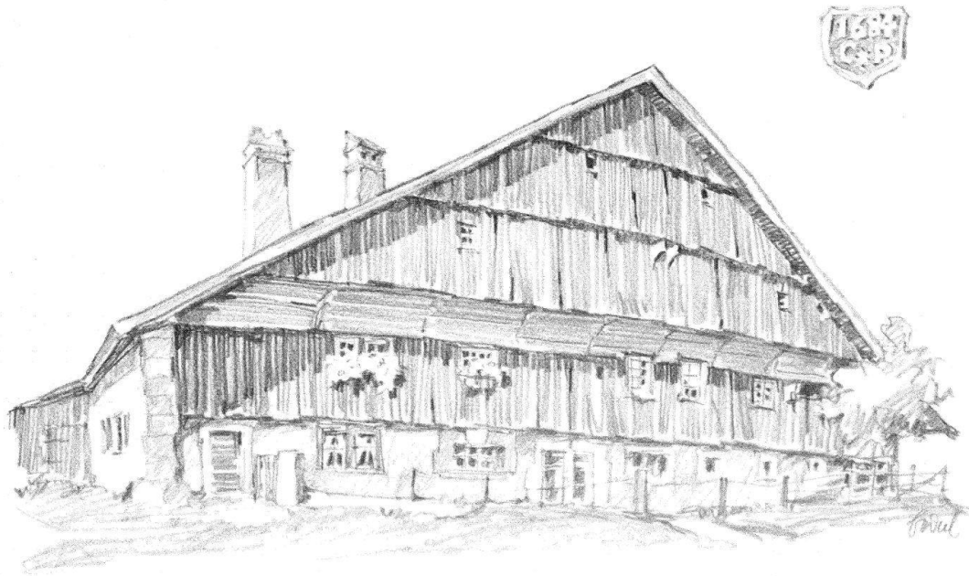
Bei La Comera - Péquignot

Bei Cornaux-Péquincourt. Im Neuenburger Jura gibt es noch das Bauernhaus des 17. und Beginn des 18. Jh. mit schwach geneigtem Satteldach, hölzerner Hochstudkonstruktion (Säulen) und gemauertem Sockelgeschoss. Das abgebildete Haus von 1684