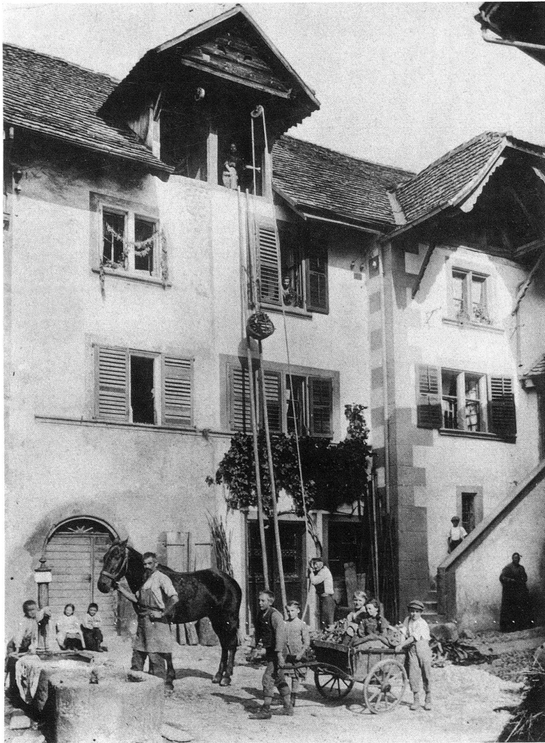
Ligerz. Am sog. Bärenplatz um die Jahrhundertwende. Aufzugsgiebel («Estrichlöcher») für Brennholz, Heu und andere Vorräte. Links zwei zusammengefasste spätgotische Hauseinheiten. Rechts ein Haus von 1699; wohl gleichzeitiger Aufzugsgiebel in städtischer Art mit geschnitztem Bugpaar und fassoniertem Ortbrett als Vorform der «Ründe» (hier noch keine Untersichtverchalung); für zahlreiche Rebbauernhäuser charakteristischer gemauerter Aussenaufgang