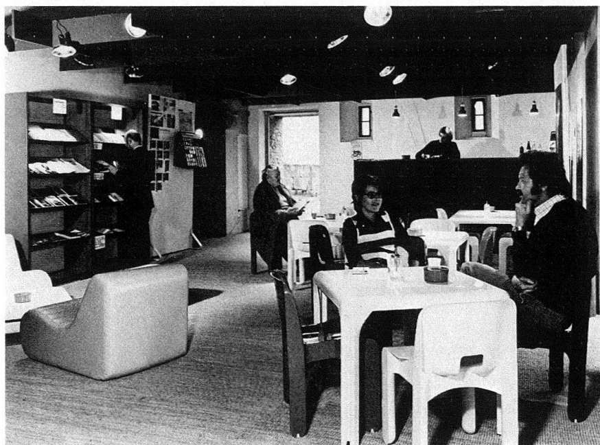
Schloss Lenzburg. In der Cafeteria, kombiniert mit interessanter Literatur aus der Buchhandlung, lässt sich trefflich diskutieren und ausruhen

Mit der Schaffung eines soliden technischen und wissenschaftlichen Fundamentes, mit einer viergliedrigen Ausstellungsinszenierung, mit vielen besucherkonformen Erleichterungen, mit der Fortsetzung bisheriger und der Aufnahme neuer Aktivitäten sollte – die Vorteile des Standortes noch dazu genommen – ein Museum entstehen, das dem Kulturkanton angemessen ist.