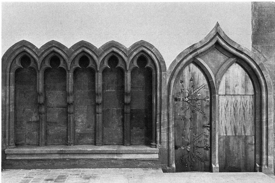
Basel. Predigerkirche, Chor. Priestersitze (früher Zelebrantenbank) und neu entdeckter Sakristeieingang

Von diesem Typus der frühen Bettelordens-Gotteshäuser haben sich im nördli-chen Europa nur wenige Vertreter erhalten; noch geringer indessen ist der überlieferte Bestand an derart frühen Sakralbauten im oberrheinischen Gebiet, welche vor allem deshalb von speziell hohem Interesse sind, weil in ihnen der Gedanke unbedingter Schlichtheit, die Verschmelzung von Langhaus und Chor zu einer geschlossenen kubi-schen Einheit besonders folgerichtig durchgeführt wurde. In ihrem Grundriss- und Aufbauschema zogen sie gewisse Anregungen der Hirsauer Bauschule (die auf dem