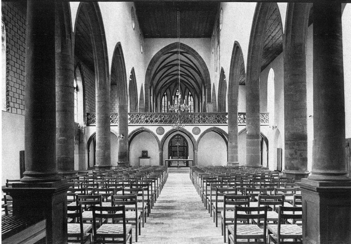
Basel. Predigerkirche. Langhaus, neu eingebauter Lettner, erhöhter Triumphbogen und Chor nach der Restaurierung

lung um die zwei am Westgiebel symmetrisch von beiden Seitenschiffestrichen emporsteigenden Dachtreppen ebenso leicht herstellen wie die Decken der Seitenschiffe, wo unter den Gipsplafonds leider keine Originalbestände mehr vorhanden gewesen sind.