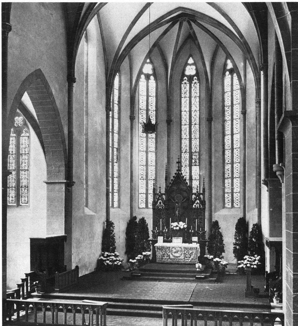
Basel. Predigerkirche. Das Altarhaus vor der Restaurierung (Aufnahme Mai 1950)

Trotzdem die restaurierte Predigerkirche in Basel nicht mehr in ihrer angestammten Umwelt steht, vermag sie als bedeutendes Kunstdenkmal sowohl innen wie aussen noch immer eine hervorragende Wirkung auszuüben. Sie erhebt sich städtebaulich betrach-