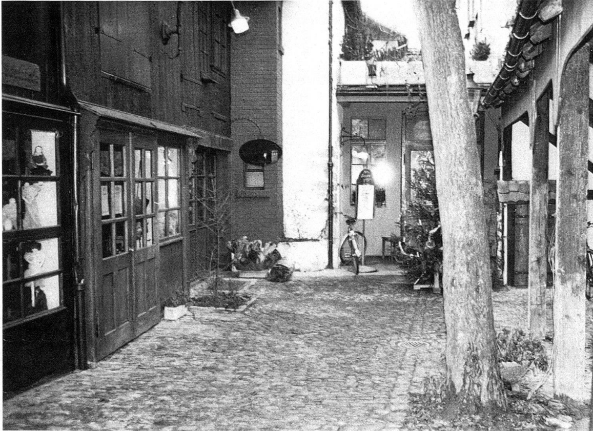
Winterthur. «Neustadt». Junge Kunsthandwerker und Ladenbesitzer haben ein originelles «Einkaufszentrum» gestaltet

lag. Man einigte sich endlich auf einen Plattenbelag, der in quer zur Gasse verlaufenden Streifen von wechselnder Breite (15, 20, 25 cm) verlegt wurde, mit einem mittleren Rinnstein aus demselben Stein. Als Material wäre wohl ein bräunlicher Sandstein am schönsten gewesen – dieser ist aber allzu bruch- und frostempfindlich. Granit wiederum schien zu hell, Gneis oder Alpenkalk zu dunkel. So fiel die Wahl auf rötlich grauen Porphyrt, der neben seiner Härte und Frostbeständigkeit auch eine sehr ebene, aber griffige Oberfläche zeigt.