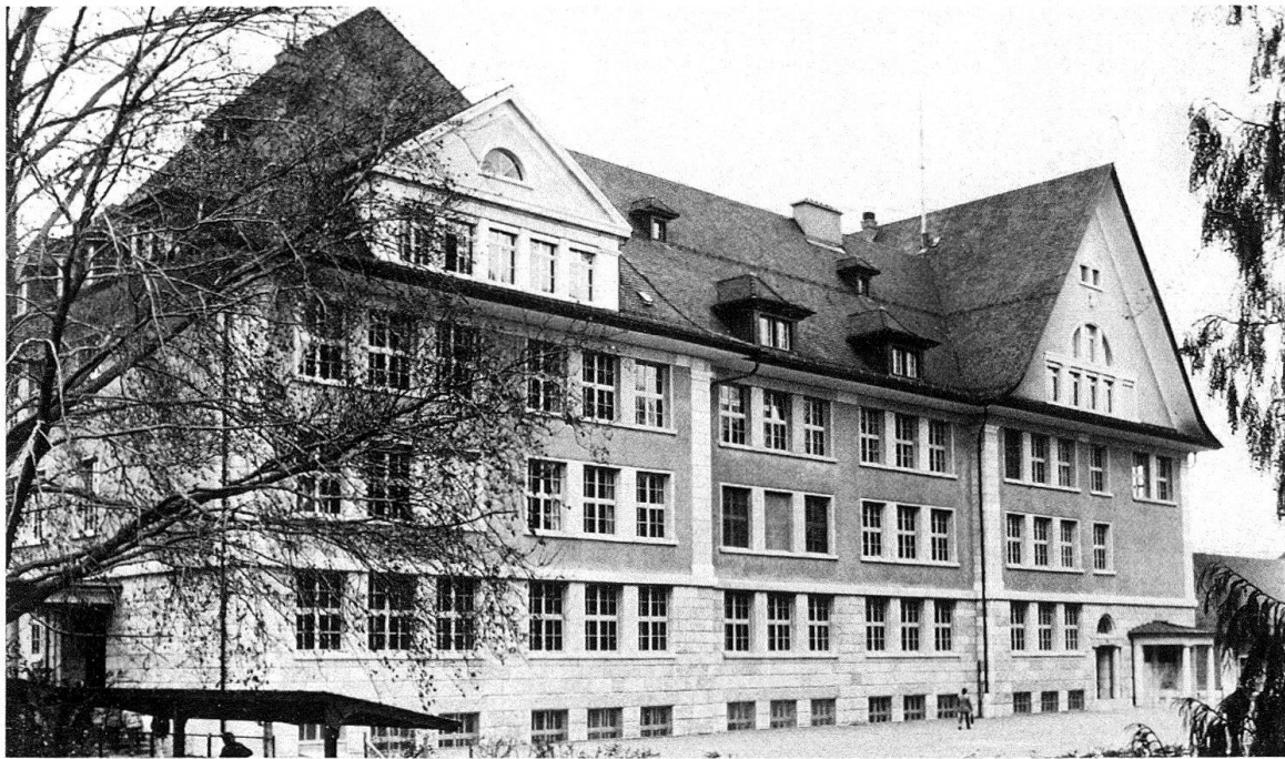
Winterthur. Schulhaus «Heiligberg», erbaut 1909–1912 von den Architekten Bridler + Völki, 1976–1978 innen und aussen vollständig renoviert

Raumschöpfung von höchster Qualität ist die lichterfüllte zentrale Halle. Die kühn hingestellte Treppe schwingt sich zur umlaufenden Galerie hinauf, beide aus einer genieteten Stahlkonstruktion bestehend, die zum Teil frei auskragt, zum Teil auf kurzen Säulen mit elegant geformten Blattkapitellen ruht. Antrittspfosten, Geländer und Wandflächen sind mit phantasievollen Jugendstilornamenten zurückhaltend geschmückt.