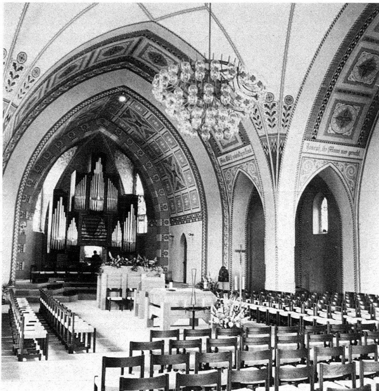
Töss. Katholische Kirche St. Joseph. 1913/14 erbaut von Adolf Gaudy, 1977 restauriert

Dank der sorgfältigen Restaurierung des gesamten Wandmalerei-Programms ist ein ausserordentlich ausdrucksvoller, festlicher Raum von hoher Originalität entstanden.