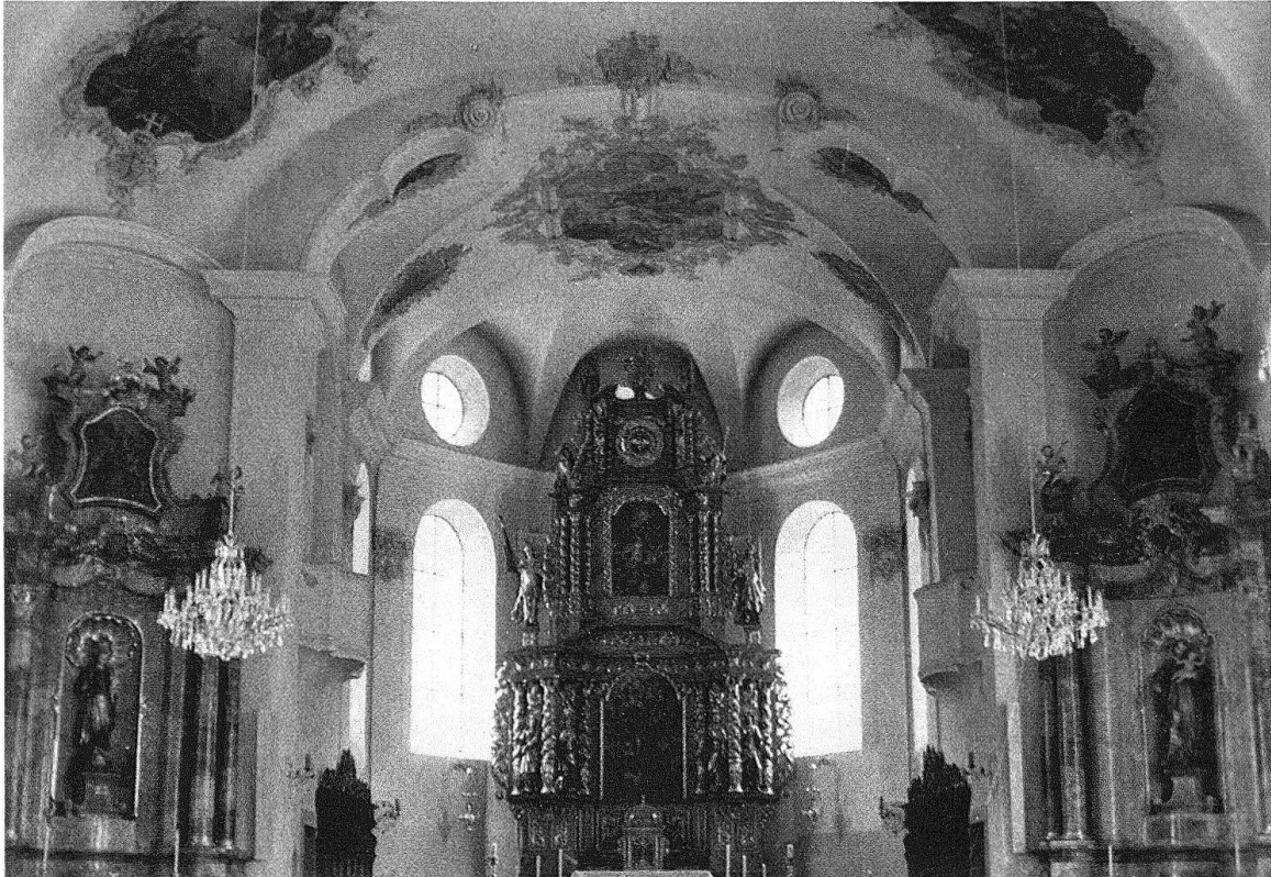
Abb. 5. Silenen. St. Albin, 1754–1756 als Einheitsraum erbaut