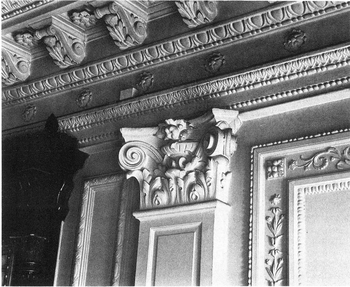
St. Gallen. «Helvetia». Wand- und Deckengestaltung des Sitzungszimmers des Verwaltungsrates im Erdgeschoss

so einig wie in diesem Falle! Es sei technisch nichts mehr zu helfen ... dabei haben wir schon etliche Objekte ähnlich schlechten oder noch schlechteren Zustandes retten können ... erwähnen wir nur die laufende Restaurierung der Haupthalle des Zürcher Hauptbahnhofes. Und dann: die Umgebung der «Helvetia» habe man architektonisch schon so abgebaut, und durch Neubauten verdorben (so!), dass die «Helvetia» in dieser Gesellschaft zu keiner baukünstlerischen und städtebaulichen Ausstrahlung mehr gelange. Nun, das ist wahr: man hat dem Quartier durch den Abbruch des alten Bahnhofes von 1855/56 und erst kürzlich noch des 1885–1887 von Hirsbrunner und Baumgartner errichteten Rathauses übel mitgespielt. Jetzt ist der «alte Sandhaufen Helvetia» beseitigt. Soll nun aber das Spielchen mit dem St. Galler Abreisskalender in Richtung Bahnhof einfach weitergehen? Was soll mit den Bauten geschehen, die immerhin mit glanzvollen Namen wie Pflughard und Haefeli oder Curjel und Moser verbunden sind? Das Bahnhofgebäude – A. von Seenger, 1911–1914 – und die Post – Pflughard und Haefeli, 1910–1914 – zählen zu den hervorragendsten Verkehrsbauten in weiter Runde. Soll man weiter sündigen, weil das durchlöchernte Quartier an denkmalpflegerischem Gewicht verloren hat und die noch bis vor kurzem vorhandene Schwerpunktbildung in Frage gestellt ist?