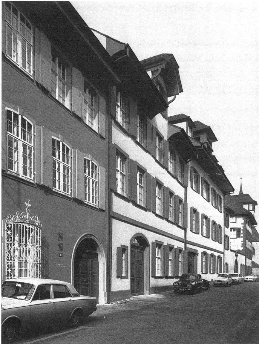
Basel. Nadelberg 10-4. Blick gegen Peterskirche mit «Schönem Haus» (Nr. 6), und «Schönem Hof» (Nr. 8); ganz links Zerkindenhof (Nr. 10). Nach der Restaurierung, Herbst 1969

12 Vgl. FRANÇOIS MAURER, Die Kunstdenkmäler des Kantons Basel-Stadt , Bd. IV, Basel 1961, Abb. 192, 209.