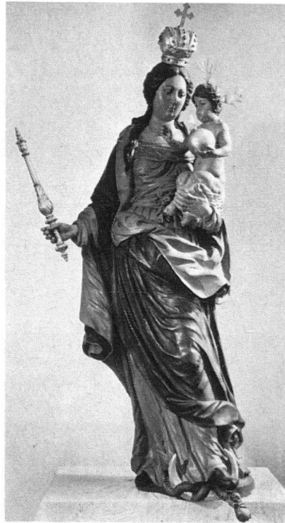
Abb. 12. Hans Wilhelm Tüfel: Hl. Ludwig von einem Nebenaltar der ehemaligen Pfarrkirche Ricken- bach, 1665, jetzt in der Pfarrkirche Wolhusen