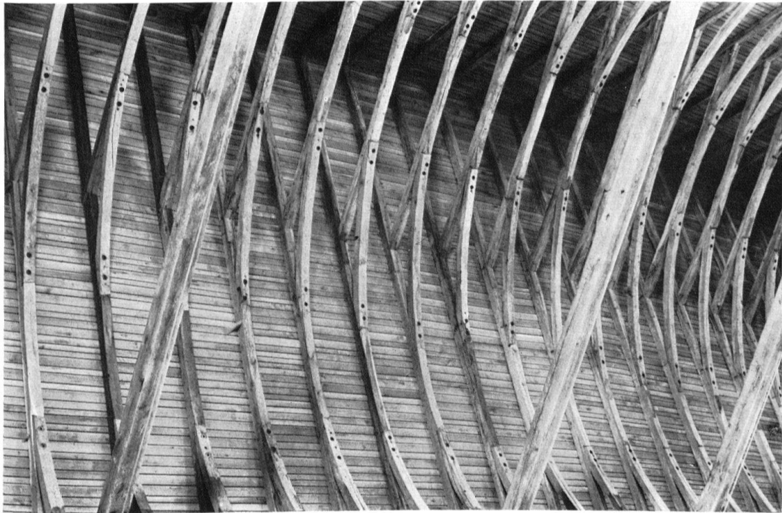
Abb. 3. Marienmünster Reichenau-Mittelzell. Der nach dem Brand von 1235 wieder hergestellte offene Dachstuhl

der Ornamentierung der Wände in den Jahren 1903–1912. Mit der zusammenstauchenden Verpflanzung des Chorgitters in den nördlichen Seitenschiffarm und der Neutünchung der Wände war 1930 ein Status erreicht, der angesichts der Verarmung des Bodenreliefs und dem Verlust an Zäsuren dem Blick des Betrachters über eine Länge von 80 m und etwa 25 m Breite wenig optischen Halt mehr zu bieten vermochte und zudem Räume und Bauetappen verschliff, die nie zu gemeinsamer Wirkung gedacht und vereint waren.