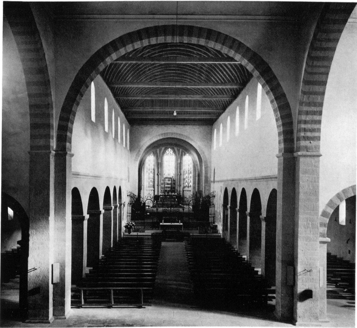
Abb. 2. Marienmünster Reichenau-Mittelzell. Ansicht vom Bernobau aus gegen das Schiff mit dem offenen Dachstuhl und den spätgotischen Chor