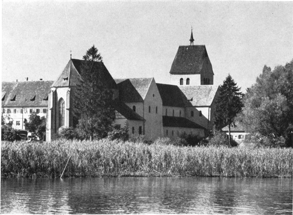
Abb. 1. Marienmünster Reichenau-Mittelzell. Der karolingisch-ottonische Bau mit der spätgotischen Chorlaterne