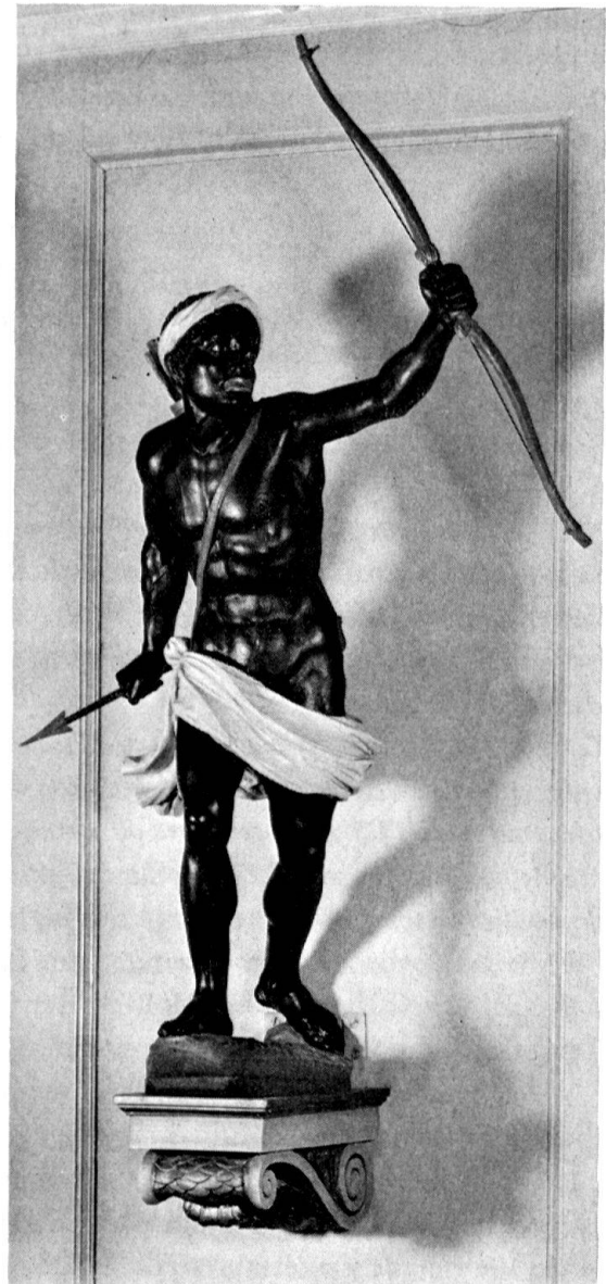
Abb. 2. «Der hölzerne Möhr». Modell von Langhans, 1710. Höhe etwa 80 cm. Bogen, Pfeil und Konsole von Pugin, 1805. Große Zunftstube, Kramgasse 12

genommen und das Postament abgemeißelt. Bereits 1803 erwogen die Stubengenossen aber, den Mohr wieder aufzustellen, entschlossen sich 1804 endgültig dazu, stießen indessen «wegen seiner außerordentlichen Schwere» und mangels eines steinernen Piedestals auf technische Schwierigkeiten, so daß ihnen nichts anderes übrig blieb, als «denselben mit eisernen Stäben und häken bestmöglichst befestigen zu lassen». So steht er heute noch an der Fassade des Zunfthauses (Abb. 1).