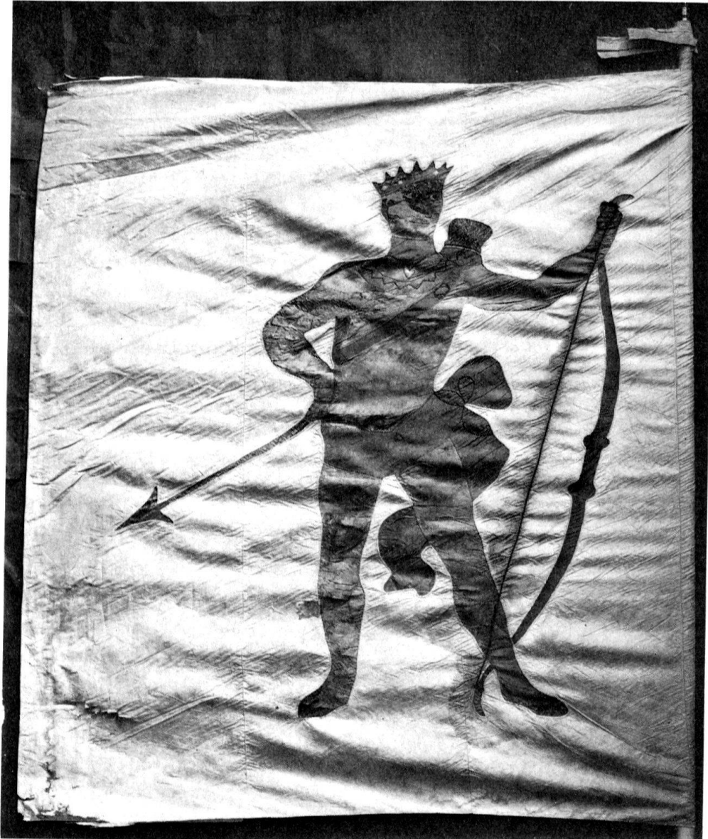
Abb. 3. Stubenfahne der Zunft zum Mohren, 16. Jh. Bernisches Historisches Museum, Depositum

in die hände» geben und ein «sehr nettes Fußgestell» – also die Konsole – dazu anfertigen. Pugin und «der Uhrenmacher hr. Froidevaux» sind dann «einander behülflich gewesen, den möhr aufzumachen und die Pendule (Abb. 4) auf die andere Seite des Zimmers zu versetzen». Heute noch schmücken die beiden Werke zwei gegenüberliegende Wände der großen Zunftstube. Überflüssig zu bemerken, daß der «hölzene Möhr» 1805 neu bemalt und lackiert wurde, und zwar von einem Maler Hermann.