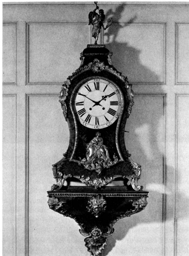
Abb. 4. Wanduhr von Matthäus Funk, 1765. Große Zunftstube, Kramgasse 12. (Vgl. Kdm Bern I, Abb. 289; II, Abb. 123)

Offensichtlich hat dem Meister der «Borghesische Fechter» vorgeschwebt, eine großartige hellenistische Marmorstatue (heute im Louvre), die er durch eine Wiedergabe kennen gelernt haben wird. Langhans aber bedachte nicht, daß der antike Kämpfer kein Schütze war, sondern ganz anders bewaffnet gewesen ist: hielt er einst doch mit der erhobenen Linken einen Bronzeschild, in der Rechten sein Schwert. Wie es scheint, hat