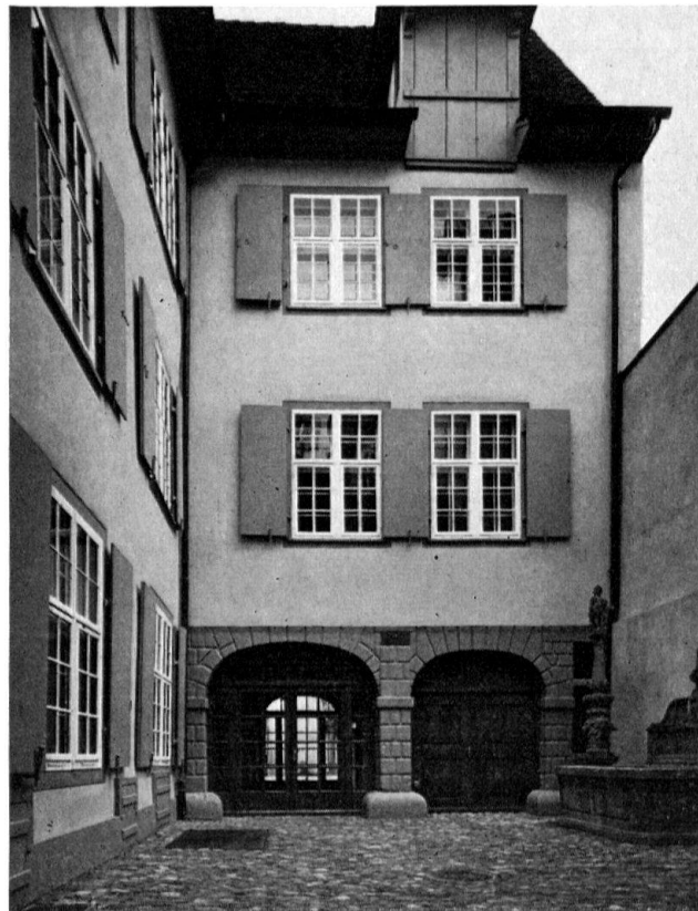
Basel, Nadelberg 10, «Zerkindenhof». Innenhof mit Längstrakt, Quertrakt und Ceres-Brunnen um 1590