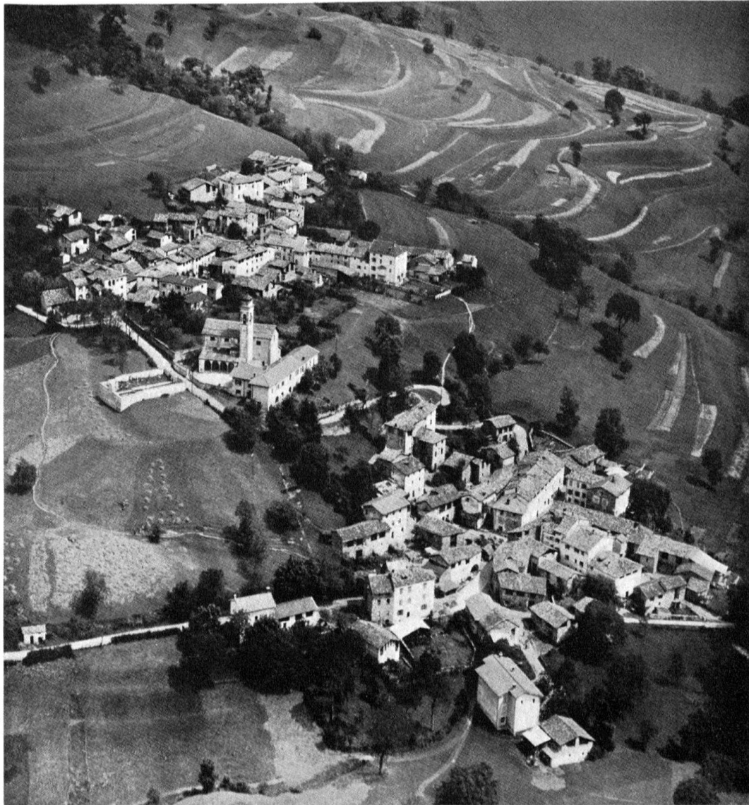
Flugansicht von Arosio, der höchstgelegenen Siedlung des Malcantone