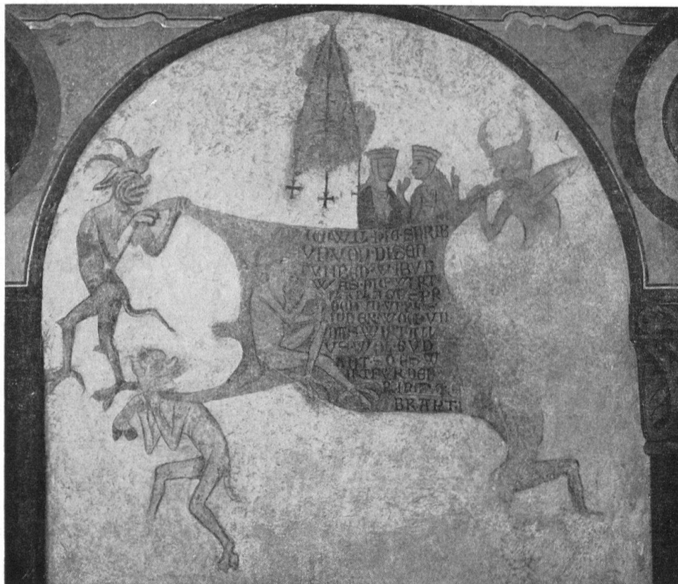
Reichenau, Oberzell. Das Sündenregister. Wandgemälde an der Nordwand. Anfang 14. Jh.