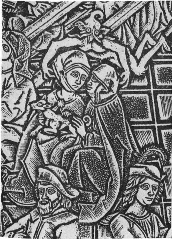
Schrotblatt, Ausschnitt aus Abb. S. 27. Um 1490