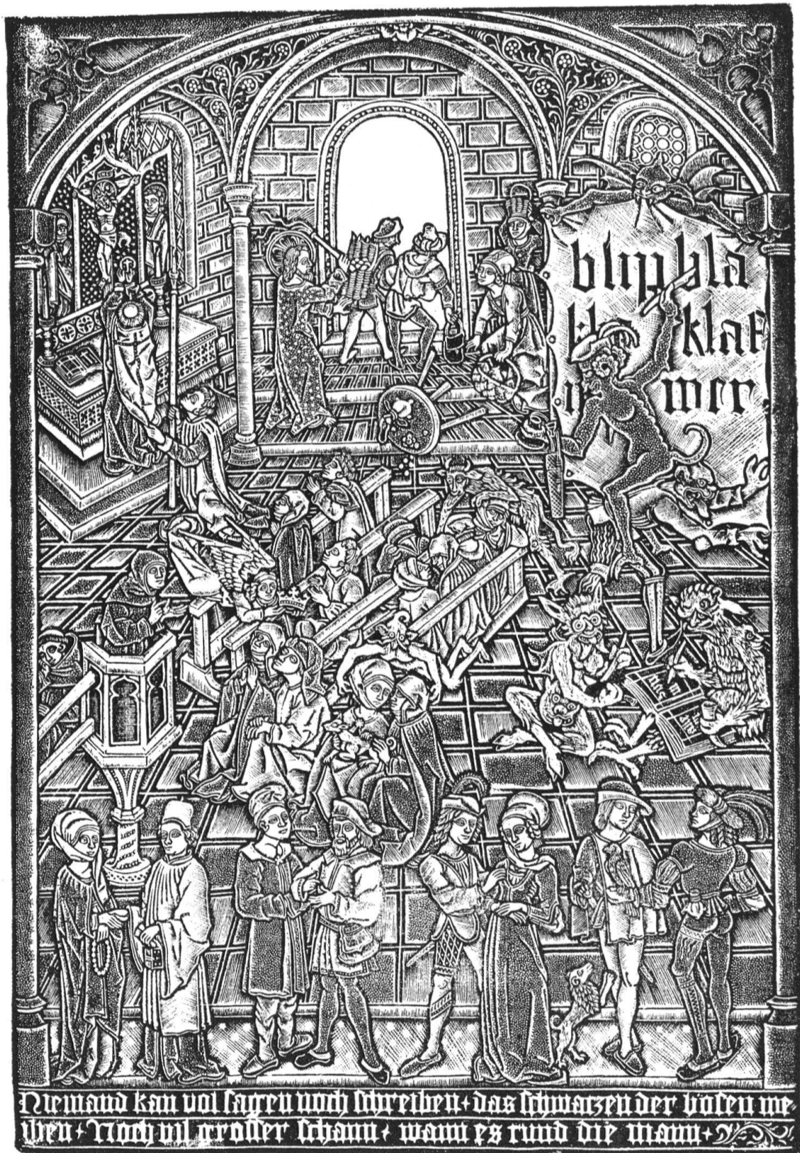
Schrotblatt des «Meisters mit dem Maschenhintergrund». Wohl aus Straßburg. Um 1490