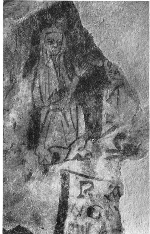
Erlenbach i. S., Pfarrkirche. Bildfragment an der Südwand. 2. Hälfte 14. Jh.