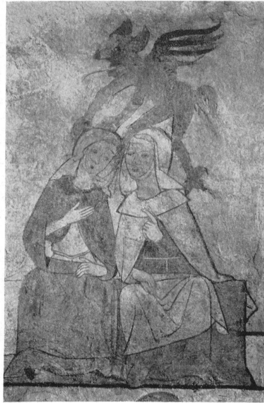
Leutwil AG, Pfarrkirche. Wandbild an der Südmauer des Schiffes. 15. Jh.

unserem Themenkreis einzuordnen. Diese im Aufbau ähnliche Dreiergruppe erscheint inmitten der figurenreichen Bühne des Schrottblattes. Im Innern einer Kirche begegnen sich dort verschiedene Menschen, welche in der Hauptsache den anwesenden Teufeln Anlaß für ihre Eintragungen in das Sündenregister geben. Die Datierung der Leutwiler Fresken in die erste Hälfte des 15. Jhs. scheint uns der teigig-weichen Gewandformen wegen gegeben.