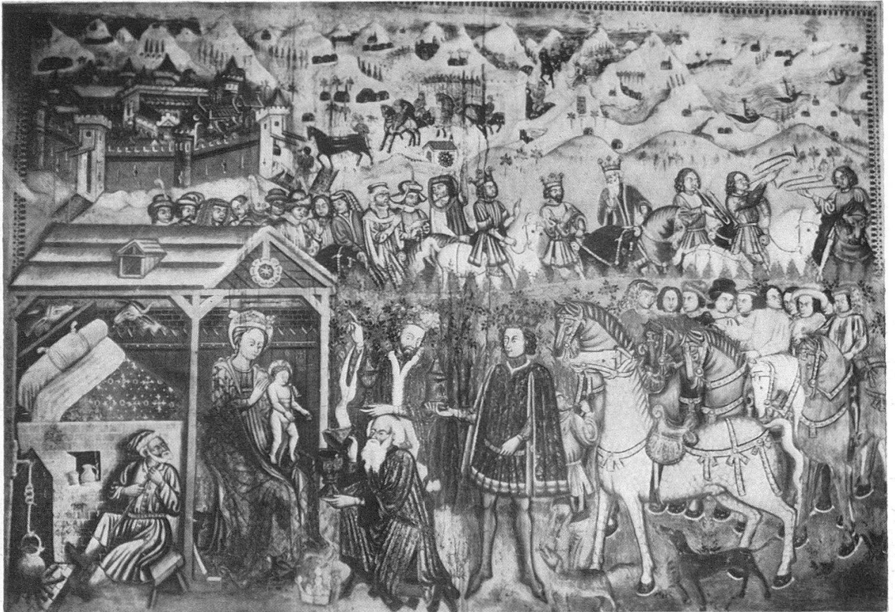
Agathakapelle bei Disentis. Dreikönigsbild an der Südwand des Schiffes. Mitte 15. Jh.

italienischen Kulturkreises. Die «nordischen» Bilder zeichnen sich mehr durch Feinheit des Pinsels und die Intimität der Szenen aus, die «südlichen» Gemälde mehr durch ihre Darstellungen im großen Maßstabe und ihr weltfreudiges Fabulieren.