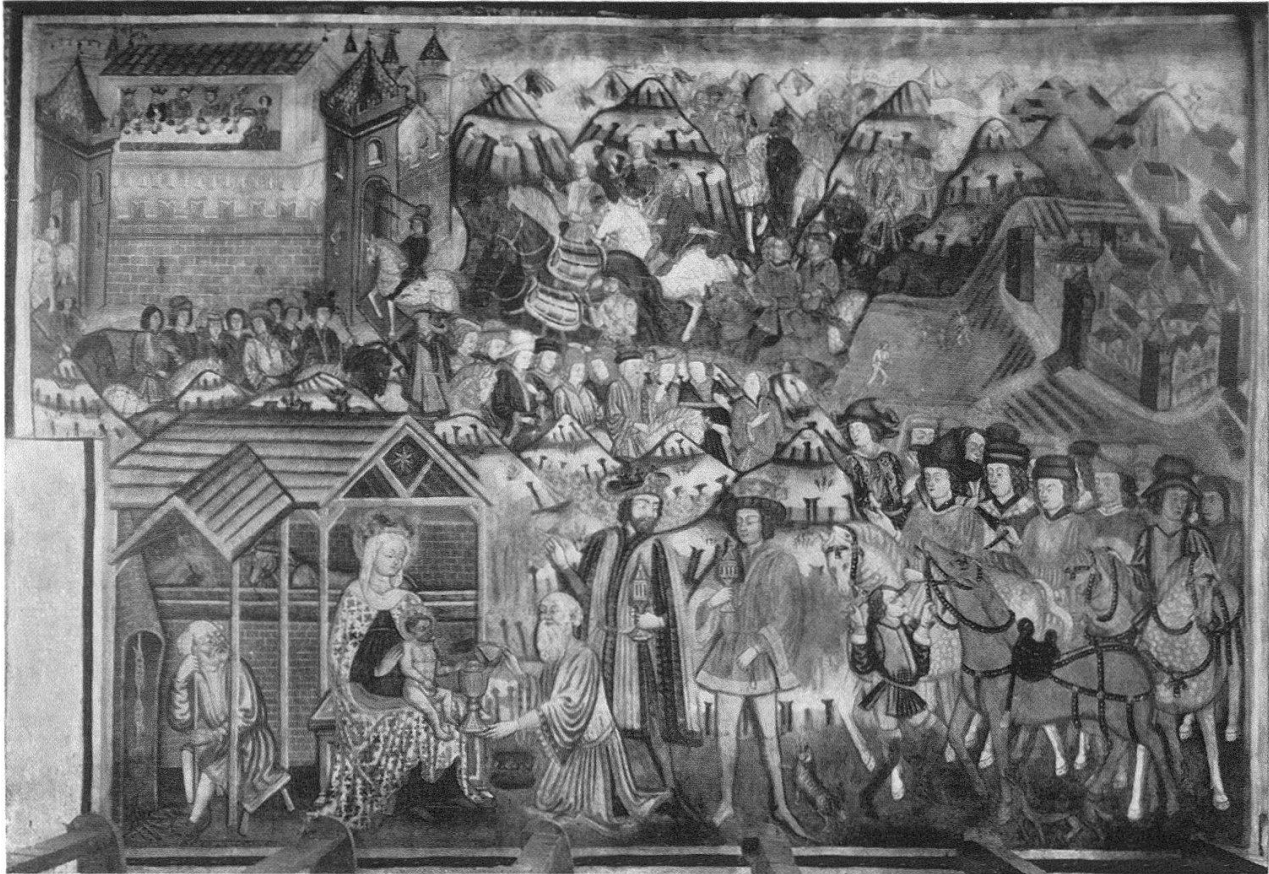
Eusebiuskapelle bei Brigels. Dreikönigsbild an der Südwand. Um 1450–60

NICOLAO DA SEREGNO oder einer derselben mit LOMBARDUS VON GIUBIASCO, mag hier nicht entschieden werden 13 .