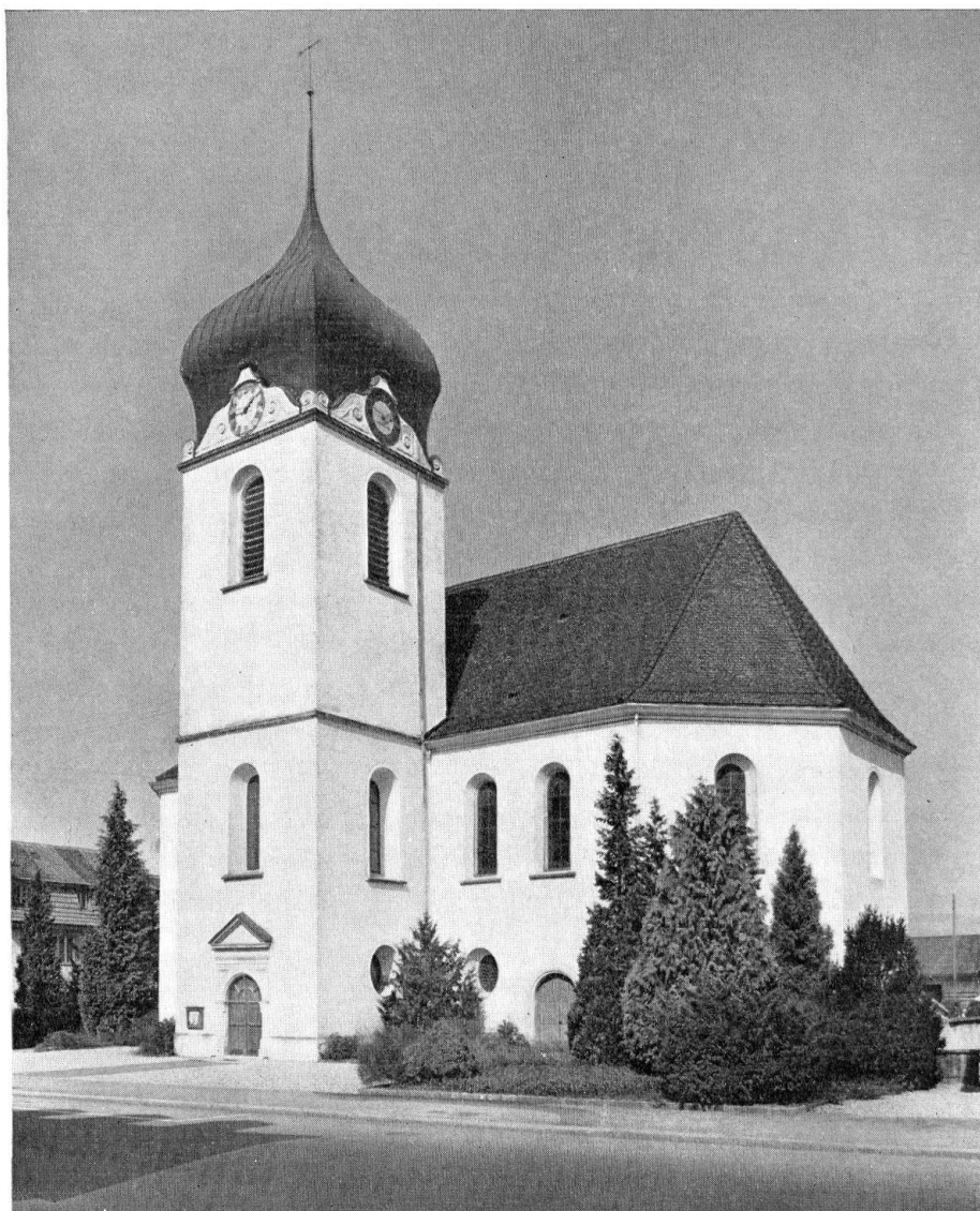
Zurzach. Reformierte Kirche. Außenansicht

Die Nachfolgebauten verpönten die kristallhafte Baukörperform der reformierten Kirche in Zurzach als ein unmodernes Erbstück des nordischen 17. Jhs. Der temple von La Neuveville und die Kirche von Maienfeld, beide vom Anfang der zwanziger Jahre, sind Rechtecksäle. Risalitartige Erweiterungen zu T- und Kreuzformen kennzeichnen die meisten Querkirchen des 18. und 19. Jhs. in der Schweiz; die Trapezform wurde erprobt und Ovale – teils reine Ellipsen, teils aus Quadrat und Zirkelschlägen zusammengesetzt – beliebten häufig als Grundriß. Wenn die Zurzacher Kirche nach jetziger Kenntnis auch nicht mehr am Beginn der Schweizer Querkirchen steht, so ist sie doch die Mutter der