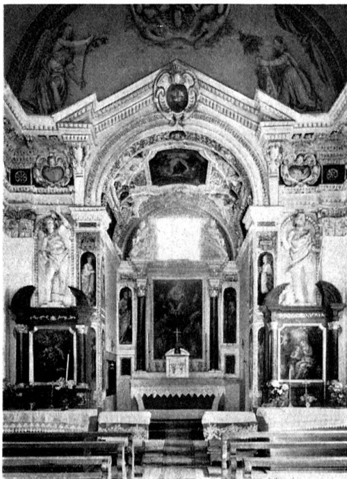
Böttstein. Schloßkapelle, Inneres

In Klingnau konnte man sich während einer kurzen Rundfahrt immerhin einen Begriff von der geschlossenen Stadtanlage und der dominierenden Stellung der Kirche inmitten von breiten Straßenzügen machen. In Zurzach bot die Stiftskirche mit dem Verengrab in der Krypta reichen Anschauungsstoff; die Führung wurde bereichert durch die Erläuterung des Kirchenschatzes durch Frau Dr. Sennhauser. Wie in Zurzach, so hatte man auch in Laufenburg die Umgestaltung eines mittelalterlichen Kirchenraumes im blühenden Rocaillestil vor sich, und in dem erst 1771 dekorierten Gerichtssaal von Laufenburg sah man nochmals das Rokoko in voller Entfaltung. – Hatten schon alle diese Bau-