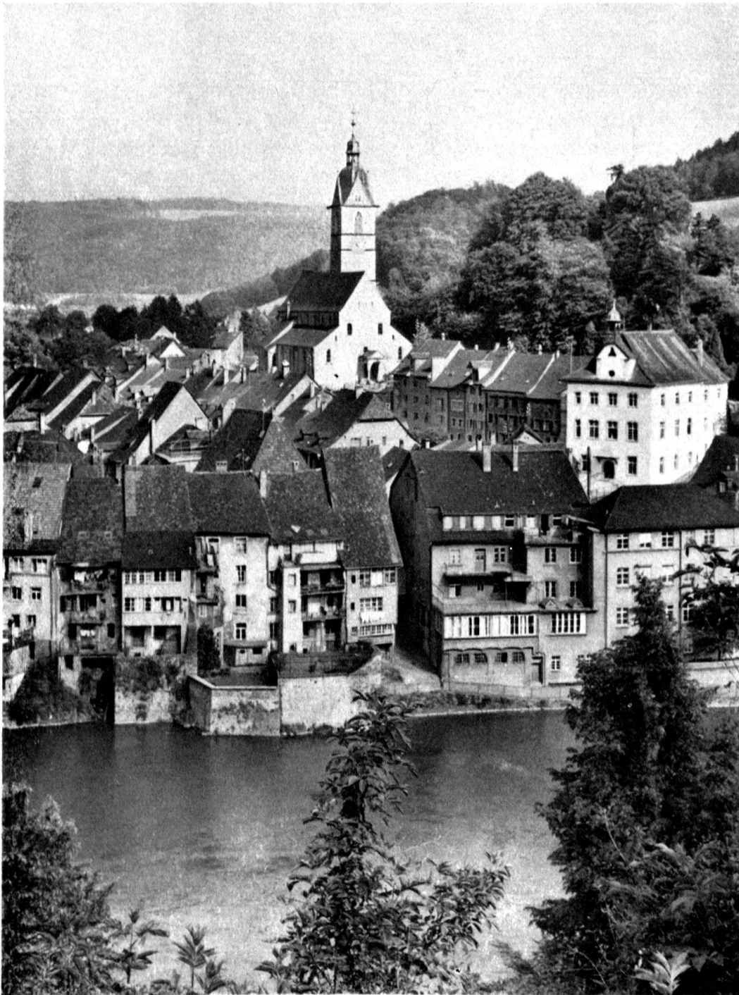
Laufenburg. Ansicht von Nordwesten