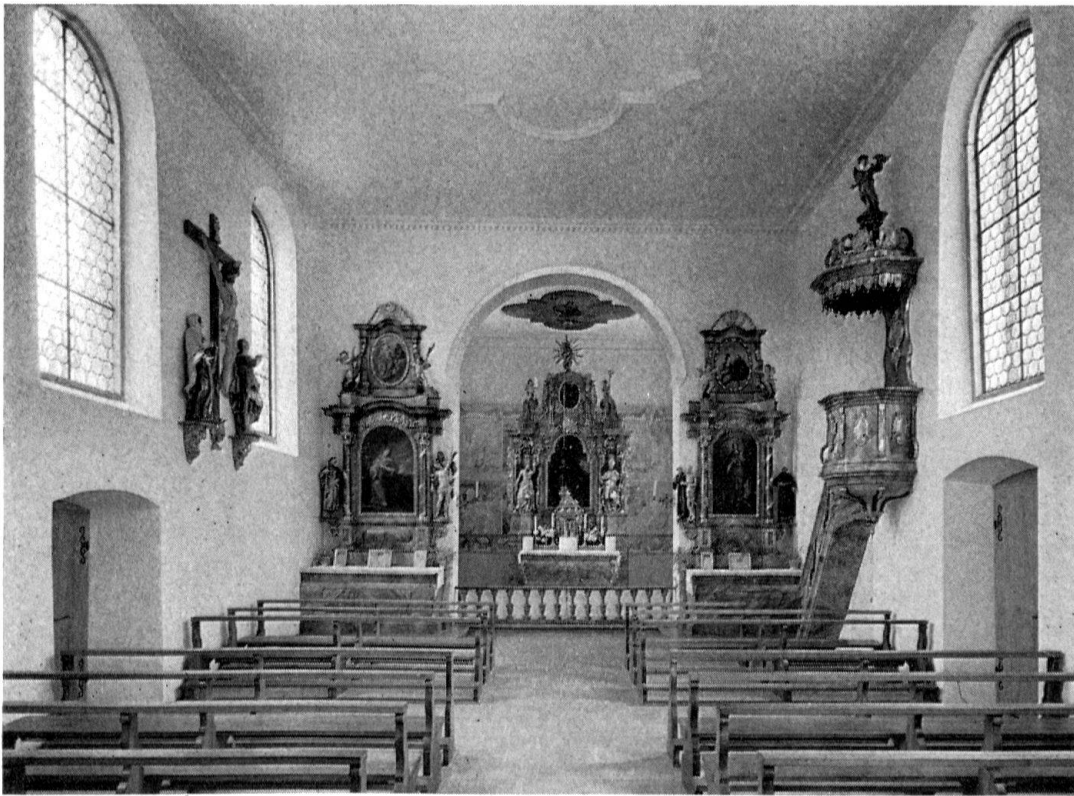
Inneres der restaurierten Pfarrkirche Kaiseraugst. Blick gegen den Chor