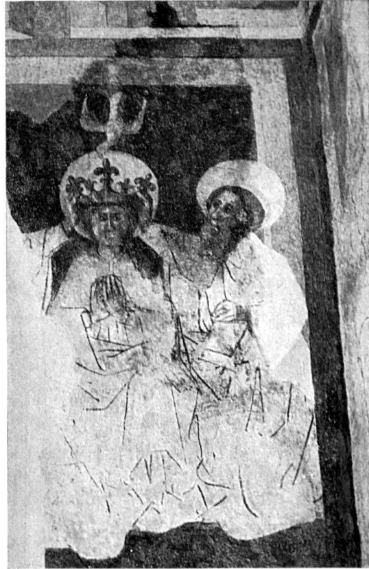
Wurzel Jesse und Krönung Mariae. Wandgemälde an der Chorwand der Pfarrkirche von Kaiseraugst