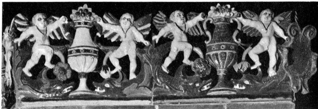
Altishofen, Schloß. Detail vom Ofen des Meisters MK, 1577

Die bürgerliche Architektur von Willisau ist bescheiden, derjenigen von Sempach vergleichbar. Die bäuerliche Bauweise hingegen schafft mit ihren geschnitzten Speichern im Amt Willisau einen Höhepunkt schweizerischer Volkskunst. Reich und vielfältig ist wie fast überall im Kanton die Kirchengestaltung mit Werken der Stukkateure, Freskomaler, Altarbauer, Bildschnitzer, Maler und Goldschmiede, vor allem des 17. und 18. Jhs. Die bedeutendsten profanen Räume besitzen die Schlösser Altishofen und Willisau.