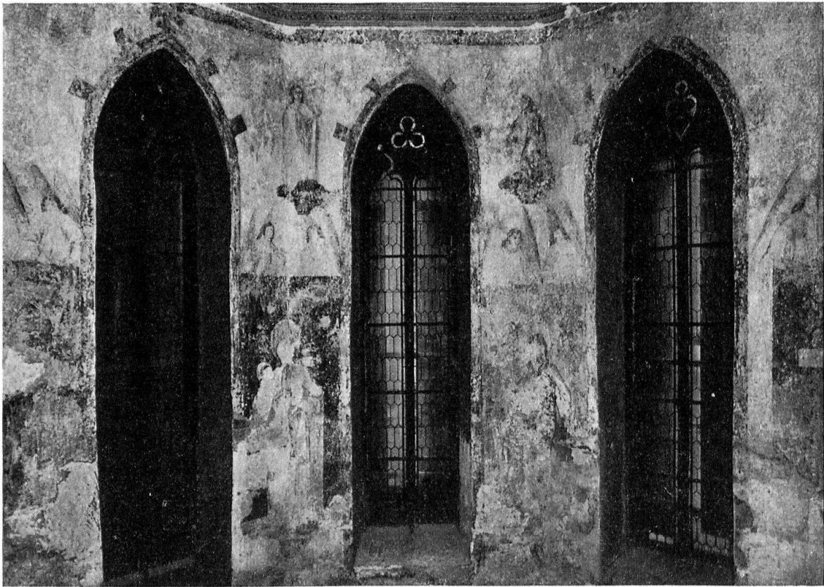
Pratteln, Kirche. Ansicht des Chorhauptes mit dem deutlich erkennbaren Gesamtplan der um 1480 entstandenen Malereien. Heute zerstört.

(Traduction d'un texte rédigé en allemand par M. H. Schneider)