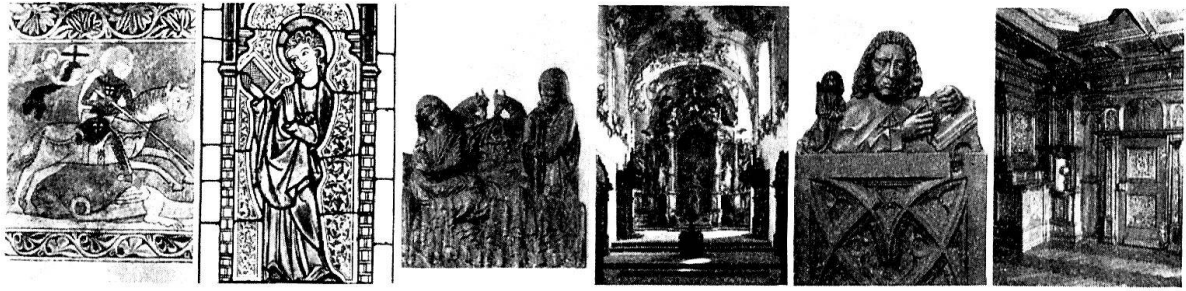
Photoserie Thurgau: Buch, Wandmal.; Oberkirch, Glasgemälde; Liebenfelderrelief; Ittingen, Kartause; Chorgestühl aus Katharinental; Tänikon, Beichtigerzimmer.