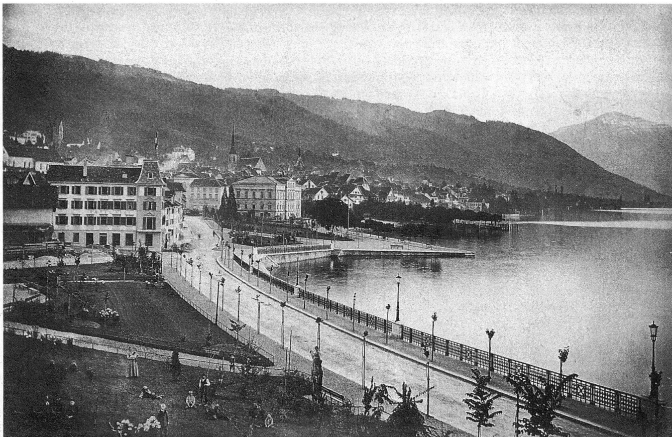
Zug, die Vorstadt nach dem Wiederaufbau mit der 1891 fertiggestellten, grosszügigen Seepromenade. Zeitgenössische Fotografie.

rich über Thalwil nach Zug und nach Arth-Goldau Richtung Gotthard siedelten sich in Zug und in dessen näherem Bahnhofgebiet weitere Industrien an, entstanden geplant neue Quartiere und firmeneigene Wohnüberbauungen. In der Neustadt wurde 1906 die protestantische Kirche eingeweiht. Zug als Fabrikstadt war zusammen mit dem Trauma der Vorstadt-Katastrophe ein Argument gegen den Bau der Zugerberg-Standseilbahn. Diese wurde 1907 trotzdem eröffnet. Weitere Wohn- und Gewerbequartiere dehnten sich längs der alten Wege und der im 19. Jahrhundert geschaffenen Strassen bis zur Gemeindegrenze aus. 1925 wurde erstmals ein genereller Bebauungsplan für das gesamte Stadtgebiet erstellt.