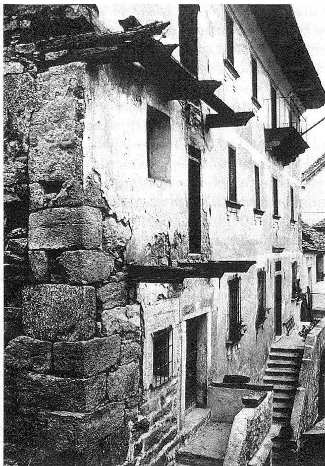
4, 5 Due esempi di degrado dell'architettura rurale delle valli attorno al Lago Maggiore.

ture basate sull'utilizzazione di strumenti informatici e computerizzati. Queste informazioni con l'ausilio di nuovi sistemi di comunicazione sempre più diffusi (rete pubblica basata su mezzi trasmissivi, bande, cavi coassiali ed in futuro fibre ottiche, e su una metodologia di trasmissioni a commutazioni di pacchetto), possono essere facilmente disponibili e fruibili in centri culturali, musei, scuole, Università, strutture e nodi dei trasporti tipo aeroporti, stazioni ferroviarie, ecc., e, più in generale, per le strutture economiche e operatori turistici. Mi auguro che in questo senso possa nascere un centro o più centri per il Lago Maggiore polifunzionali, strutturati secondo le nuove esigenze di interscambi culturali e promozionali a livello sovracomunale, in definitiva una sorta di moduli spaziali (interessante soprattutto se strettamente correlati al centro storico) funzionali per le attività di informazione ottenute con le più moderne tecnologie elettroniche, che attraverso apparecchiature molto sofisticate nella loro concezione permettano, con «minitel» di facile fruizione, la coinvolgente trasversalità e il collegamento tra operatori e semplici cittadini di ambiti culturali e di esperienze difformi 6 .